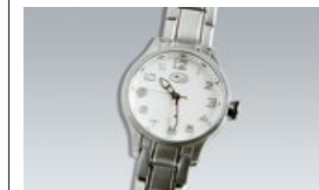
76 Damenuhr SUBARU 1062-0579

Mit zusätzlichem Seitenaufprallschutz. Sichere Befestigung dank ISOFIX-System.