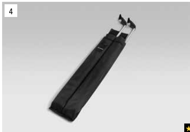
4 Aufbewahrungstasche für Dachgrundträger

Perfekt in Design und Funktion. Ein leichtgewichtiger, stabiler Träger.