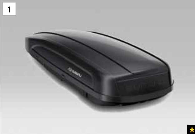
1 Dachbox Sport (Schwarz / Silber)