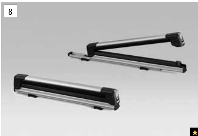
8 Ski-Aufsatz (max. 5 Paar)

*Aluminium-Dachgrundträger zusätzlich erforderlich.