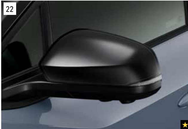
22 Schutzfolie für die Außenspiegel