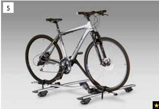
5 Fahrradaufsatz "Premium"