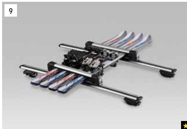
9 Ski-Aufsatz (max. 4 Paar / 2 Paar)

*Aluminium-Dachgrundträger zusätzlich erforderlich.