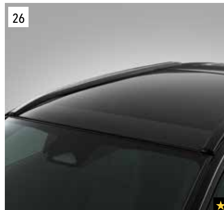
26 Steinschlagschutzfolie für das Fahrzeugdach

Transparente Folie zum Schutz der Griffmulden vor Kratzern. *Set mit 2 Folien.