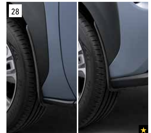
28 Schmutzfängersatz vorne & hinten

SETRFJ8010: "High Performance" - Verbesserte Wischleistung auch unter schwierigen Bedingungen und bei hoher Geschwindigkeit. SETRFJ8000: "Hybrid" - Hochwertige Ersatzwischerblätter zur Aufrechterhaltung der Wischleistung.