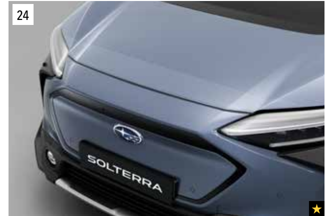
24 Steinschlagschutzfolie für die Fahrzeugfront

Transparente Folie zum Schutz der Türkanten vor Kratzern. *Set mit 4 Folien.