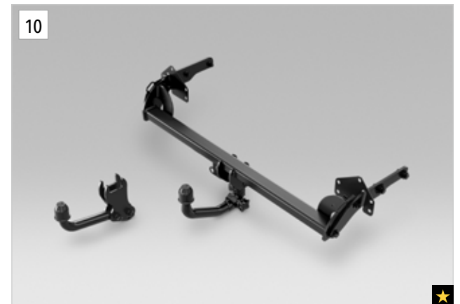
10 Anhängerkupplung (starr / abnehmbar)

*Aluminium-Dachgrundträger zusätzlich erforderlich.