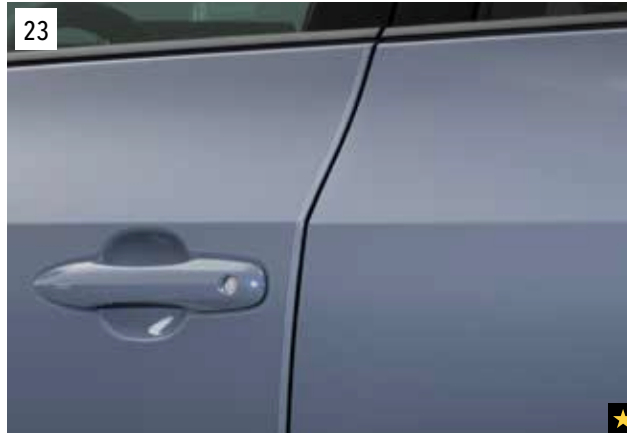
23 Schutzfolie für die Türkanten

Transparente Folie zum Schutz der Außenspiegel vor Kratzern und Steinschlägen. *Set mit 2 Folien.