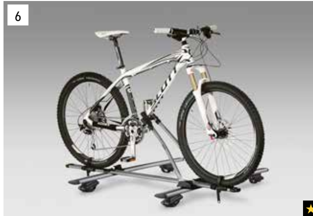
6 Fahrradaufsatz "Basic"

*Aluminium-Dachgrundträger zusätzlich erforderlich.