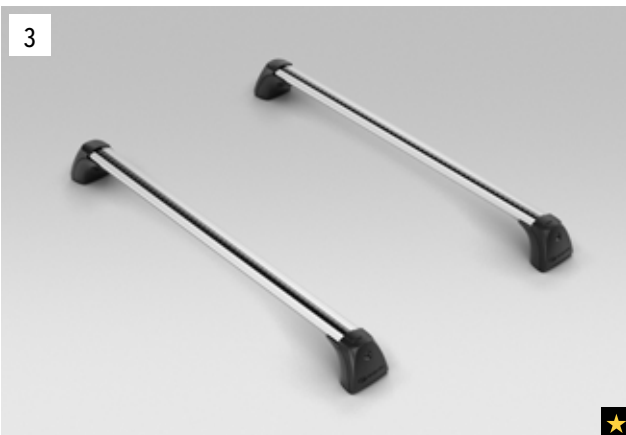
3 Aluminium-Dachgrundträger C-Slot

*Aluminium-Dachgrundträger zusätzlich erforderlich.