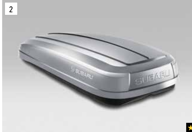
2 Dachbox kurz (Schwarz / Silber)

*Aluminium-Dachgrundträger zusätzlich erforderlich.