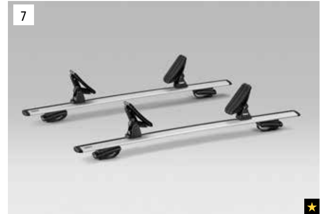
7 Kajak- und Bootaufsatz

*Aluminium-Dachgrundträger zusätzlich erforderlich.