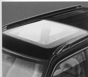
Elektr. Panorama-Glasschiebedach (GX)