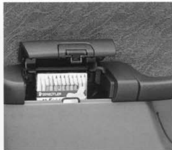
Staufach Türarmlehne (vorne und hinten)