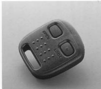
Zentralverriegelung mit Funkfernsteuerung