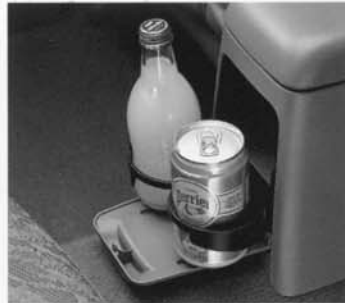
Aufklappbare Getränkehalterung im Fond