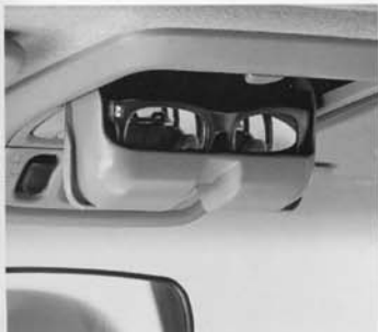
Brillenfach in der Dachkonsole