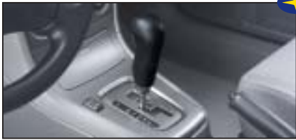
Lederschaltknopf für Automatikgetriebe