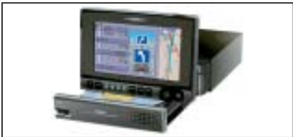
Navigationssystem Clarion NVS 613, inkl. CD-ROM