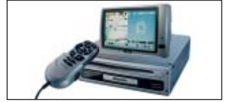
Navigationssystem VDOdayton MS 5000, exkl. CD-ROM