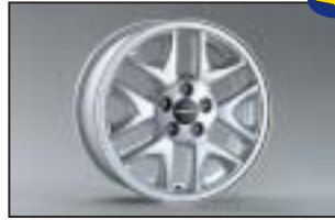
Alufelge 6,0 x 15\", ET 48