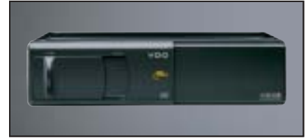
6-fach CD-Wechsler VDO CDC 601 A