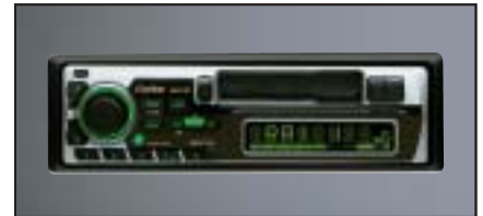
RDS-EON Cassettenradio Clarion AB 223 RG