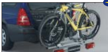
Fahrradaufsatz für Anhängerkupplung

E361ESA600 System Mont Blanc 9397-01 System AL-KO 9397-02 Nachrüstset 3. Fahrrad zu 9397-01