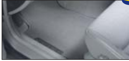
Teppichmattensatz vorne & hinten „Medium“