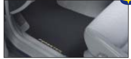
Teppichmattensatz vorne & hinten „High class“