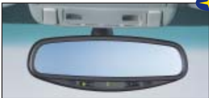
Selbstabblendender Innenspiegel mit Kompass