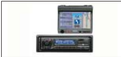
Navigationssystem Clarion VN 613, inkl. CD-ROM