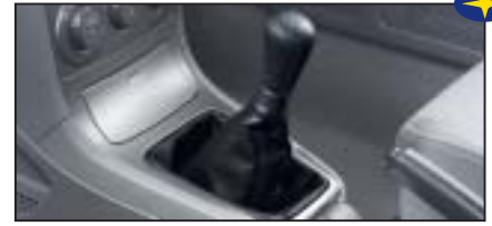
Lederschaltknopf für Schaltgetriebe