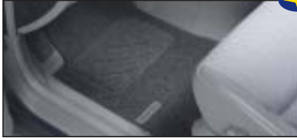
Teppichmattensatz vorne & hinten „Standard“