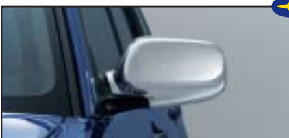
Chromblendensatz für Seitenspiegel