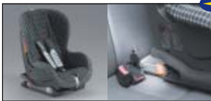
Kindersitz DUO (ISOfix)