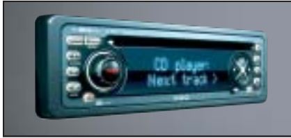
RDS Stereo-CD-Radio VDO 571 X