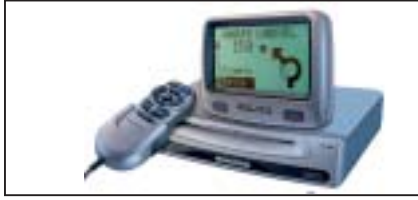
Navigationssystem VDOdayton MS 3100, exkl. CD-ROM