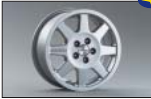
Alufelge 6,0 x 15\", ET 48