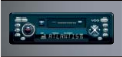
RDS Stereo-Cassettenradio VDO CR 211