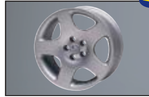
Alufelge 7,5 x 16\", ET 38