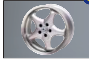
Alufelge 7,5 x 16\", ET 35