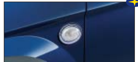
Chromringsatz für Seitenblinker