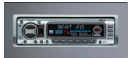
RDS-EON CD-Radio Clarion DXZ 728 R