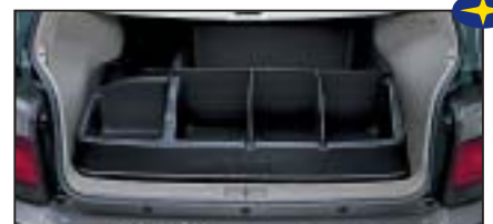
Laderaumbox mit Einteilung