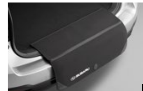
57 Textiler Ladekantenschutz E101EAJ500

Trennt den Laderaum vom Insassenbereich: Besonders für den Transport von Hunden geeignet.