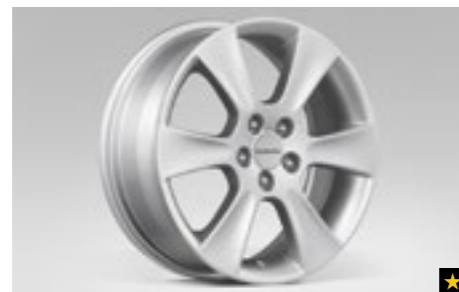
63 Leichtmetallfelge 6,5 x 16", ET 48 SECWAG4003

*Bei Fahrzeugen mit Reifenluftdruck-Kontrollsystem (TPMS) zusätzlicher Sensor notwendig.