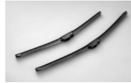
4 Premium Scheibenwischer "Aeroblades" SEBOSG8000

Stilvoll integrierbare LED Leuchten für mehr Sicherheit am Tag und zur optischen Aufwertung der Fahrzeugfront. *Lackierung erforderlich. Nicht für 2.0XT und 2.0D Sport.