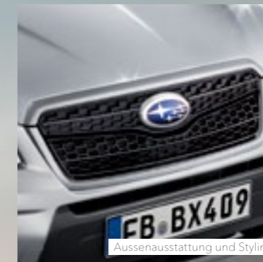
Aussenausstattung und Styling