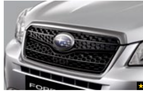
1 Gitterfrontgrill J1010SG100

Das Gittermaschendesign aus Kunststoff verleiht der Front ein ganz neues Aussehen.