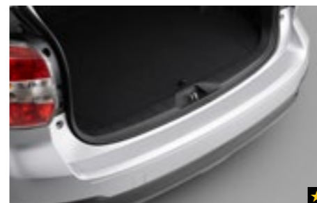
46 Stoßfängerschutzfolie (transparent) E775ESG100

Zum Schutz des hinteren Stoßfängers vor Kratzern beim Ein- und Ausladen.