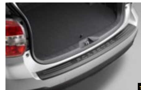
47 Stoßfängerschutzleiste (Kunststoff) E775ESG000

Zum Schutz des hinteren Stoßfängers vor Kratzern beim Ein- und Ausladen.