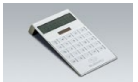
77 Dualpower Tischrechner 1142

Elegante Sportuhr mit hochwertigem Ziffernblatt in Weißmetall mit schmalen Edelstahlgehäuse.