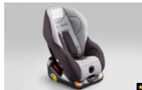
70 Kindersitz SUBARU G0/1S ISOFIX F410EYA012

*Nabenkappe zusätzlich notwendig. Bei Fahrzeugen mit Reifenluftdruck-Kontrollsystem (TPMS) zusätzlicher Sensor notwendig.