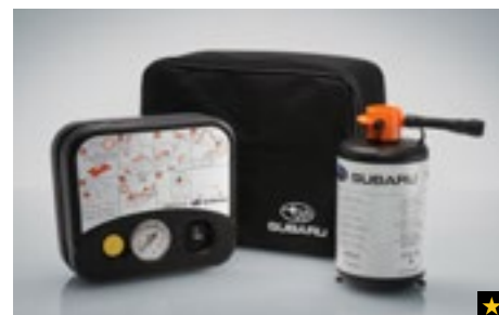
66 Reifenpannenset SETSYA4001

Eleganter Tischrechner in Pultform mit Dualpower (Batterie und Solarzelle). Hochglänzend weiß mit grauem Subaru-Logo.