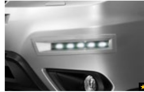
3 LED Tagfahrleuchten SENOSG3000

Zierleisten aus Edelstahl akzentuieren die Fahrzeugfront passend zu den anderen Chromteilen. *Nicht für 2.0XT und 2.0D Sport.