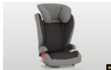
75 Kindersitz SUBARU ISOFIX Junior F410EYA217

Mit zusätzlichem Seitenaufprallschutz. Sichere Befestigung dank ISOFIX-System.