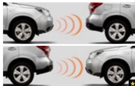
69 Ultraschall Einparkhilfen für vorne und hinten H485ESG100/H485ESG200/H485ESG000

Der Zusatzstecker wird zum Zigarettenanzünder.