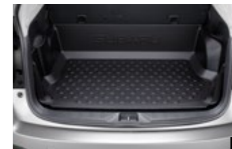
49 Laderaumbox J515ESG100

Zum Schutz des hinteren Stoßfängers vor Kratzern beim Ein- und Ausladen.