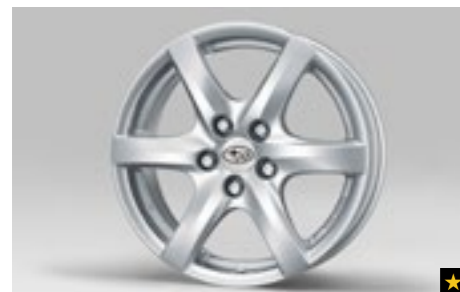
62 Leichtmetallfelge 7,5 x 17", ET 48 1247

*Bei Fahrzeugen mit Reifenluftdruck-Kontrollsystem (TPMS) zusätzlicher Sensor notwendig.