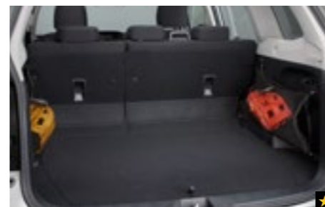
54 Gepäcknetz (Seite) F551SSG010

Zum Verstauen von Ladung. Verhindert das Herausfallen, wenn Heckklappe geöffnet ist.