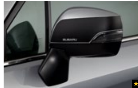
5 Dekorfolien für Außenspiegel Schwarz SEBDFJ3000

Aerodynamisches Design für bessere Performance. *Set mit 2 Scheibenwischerblättern.