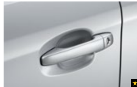
9 Griffmuldenschutzfolie SEZNF22000

Stilvolle Chromzierleisten setzen Akzente auf den Seitentüren.