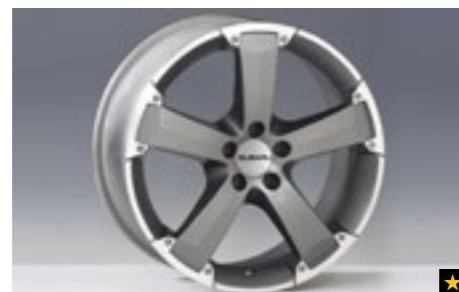
59 Leichtmetallfelge 8,0 x 18", ET 48 SEROFJ4000

*Bei Fahrzeugen mit Reifenluftdruck-Kontrollsystem (TPMS) zusätzlicher Sensor notwendig.