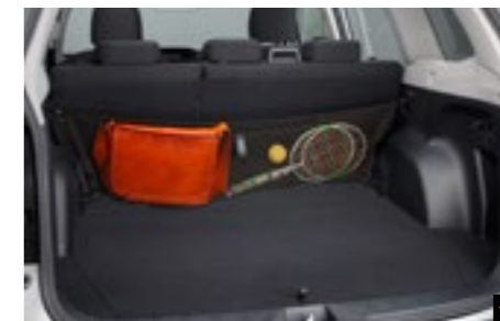
52 Gepäcknetz (Rückbank) F551SSG020

Schützt die Rückenlehne vom Laderaum her. * In Verbindung mit Laderaumschalenmatte verwendbar.