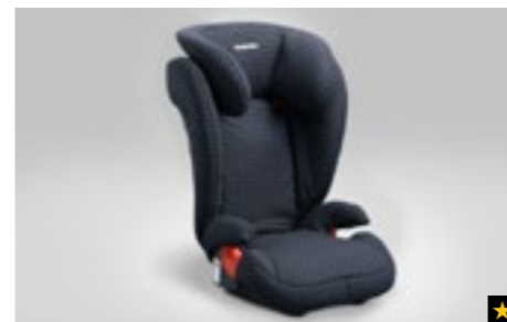
74 Kindersitz SUBARU Junior Plus F410EYA214

Diebstahlschutz für Ihre Felgen und Reifen. Besonderer Schlüssel notwendig.