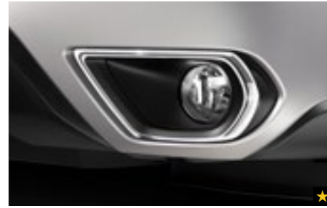
2 Chromzierleisten für die Nebelscheinwerfer J105ESG000

Das Gittermaschendesign aus Kunststoff verleiht der Front ein ganz neues Aussehen.