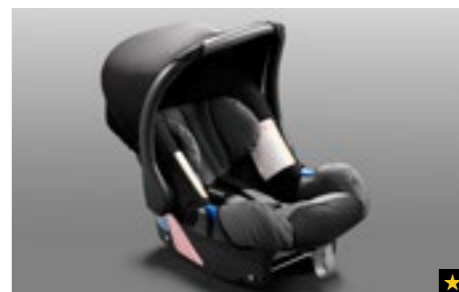
72 Kindersitz SUBARU Baby Safe Plus F410EYA104

Zur sicheren Befestigung von F410EYA012 unter Nutzung der ISOFIX-Haltepunkte.