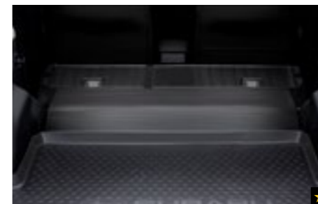
51 Rücksitzlehenschutz J515ESG200

Schützt den Laderaumboden vor Staub und Verschmutzung.