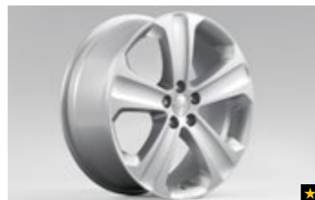
60 Leichtmetallfelge 7,5 x 18", ET 48 SECWSC4000

*Nabenkappe zusätzlich notwendig. Bei Fahrzeugen mit Reifenluftdruck-Kontrollsystem (TPMS) zusätzlicher Sensor notwendig.