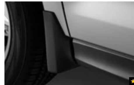
11 Schmutzfängersatz vorne J1010SG251MC

Verhindert die Heckklappe durch die elegante, attraktive Chromzierleiste.