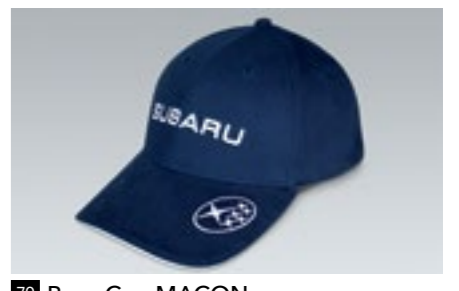
79 Base Cap MACON 2978

Flauschiger Teddy im T-Shirt zum Knuddeln.