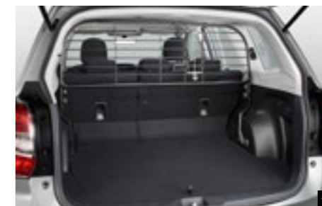
56 Laderaumtrenngitter F555ESG000

Verhindert das Verrutschen der Ladung/des Gepäcks während des Fahrens.