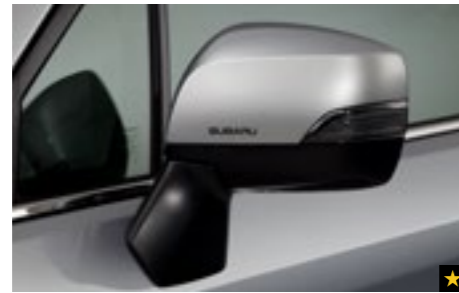
6 Dekorfolien für Außenspiegel Silber SEBDFJ3010

Verleiht den Außenspiegeln einen völlig neuen Look. *Nicht für 2.0X Active und 2.0X Trend.