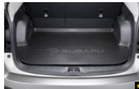
50 Laderaumschalenmatte J515ESG000

Bietet zusätzlichen Schutz für den Laderaumboden und die Seiten.