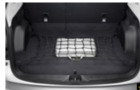
55 Gepäcknetz (Laderaumboden) F5510SC000

Entlang der Laderaumseite zur Aufbewahrung von Kleinteilen. * Set mit 2 Netzen