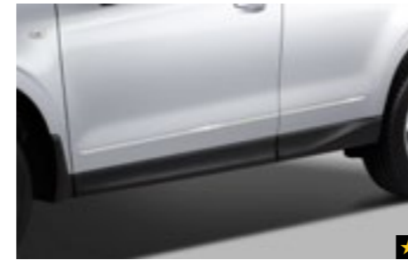
8 Chromzierleisten Seitentüren E755ESG100

Ermöglicht auch bei Regen und Schnee das Fahren mit leicht geöffnetem Fenster.