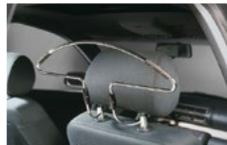
44 Autokleiderbügel zur Kopfstützenmontage 2405

Ein Chromrahmen als Akzent in der Mittelkonsole.