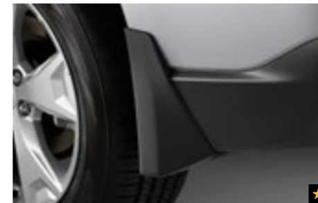
12 Schmutzfängersatz hinten J1010SG254MC

Verhindert, dass Matsch, Schnee, Teer, Steine usw. an die Karosserie gelangen.