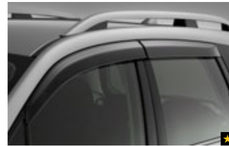
7 Seitenwindabweisersatz F0010SG700

Verleiht den Außenspiegeln einen völlig neuen Look. *Nicht für 2.0X Active und 2.0X Trend.