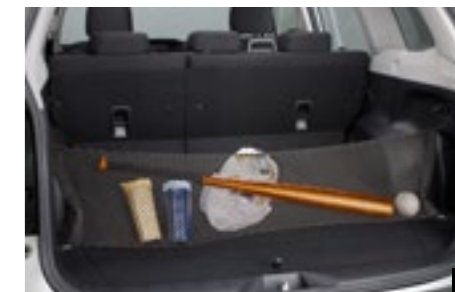
53 Gepäcknetz (Ladekante) F551SSG000

Kann über die gesamte Rückbank gezogen werden. Zur Aufbewahrung verschiedener Arten von Ladung/Gepäck.