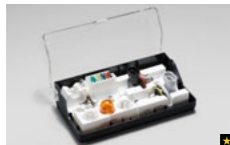
67 Reservelampenset (für Fahrzeuge mit und ohne Xenon-Scheinwerfer) SEHASG8000/SEHASG8010

Bedienungsfreundlicher, kompakter Reparatur-Kit mit Spezialdichtmittel und Mini-Kompressor.