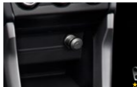
68 Zigarettenanzünder-Kit H6710SG000

*Xenon- und LED-Leuchtmittel nicht enthalten. Inhalt kann von der Abbildung abweichen.