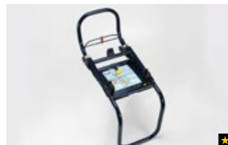
71 Kindersitz SUBARU G0/1S ISOFIX Plattform F410EYA910

Zur sicheren Befestigung unter Nutzung der ISOFIX-Haltepunkte. Verwendung mit F410EYA910.