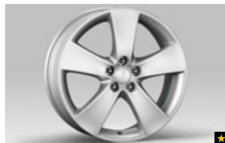
61 Leichtmetallfelge 7,0 x 17", ET 48 SECWAG4104

*Nabenkappe zusätzlich notwendig. Bei Fahrzeugen mit Reifenluftdruck-Kontrollsystem (TPMS) zusätzlicher Sensor notwendig.