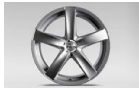
58 Leichtmetallfelge 8,5 x 19", ET 45 2919

*Bei Fahrzeugen mit Reifenluftdruck-Kontrollsystem (TPMS) zusätzlicher Sensor notwendig.