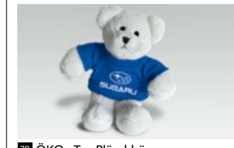
78 ÖKO - Tex Plüschbär 2921

Flauschiger Teddy im T-Shirt zum Knuddeln.