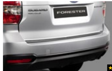
10 Chromzierleiste Heckklappe E755ESG000

Transparente Folie zum Schutz der Griffmulden vor Kratzern. *Set mit 2 Folien.