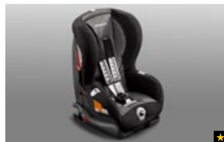
73 Kindersitz SUBARU Duo ISOFIX Plus F410EYA003