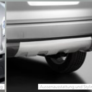
Aussenausstattung und Styling