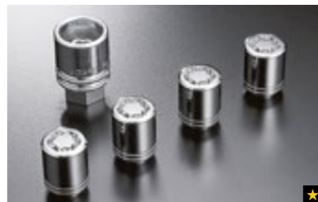
65 Felgenschlosssatz B327EYA000

*Bei Fahrzeugen mit Reifenluftdruck-Kontrollsystem (TPMS) zusätzlicher Sensor notwendig.