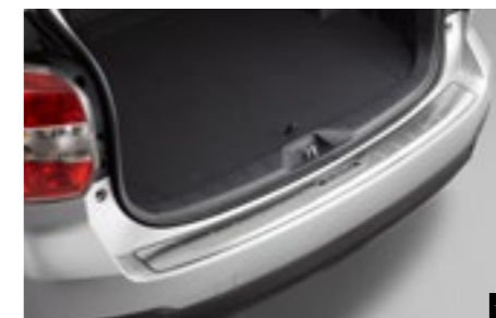
48 Stoßfängerschutzleiste (Edelstahl) E7710SG000

Zum Schutz des hinteren Stoßfängers vor Kratzern beim Ein- und Ausladen.