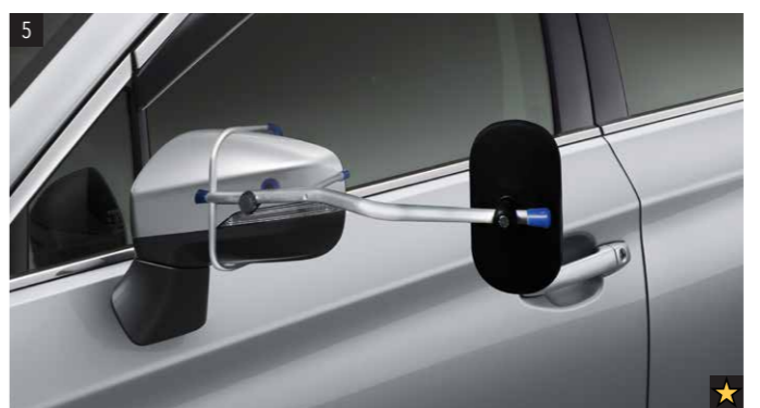
5 Caravanspiegel-Satz 2515 Für ideale Sichtbedingungen nach hinten beim Anhängerbetrieb.