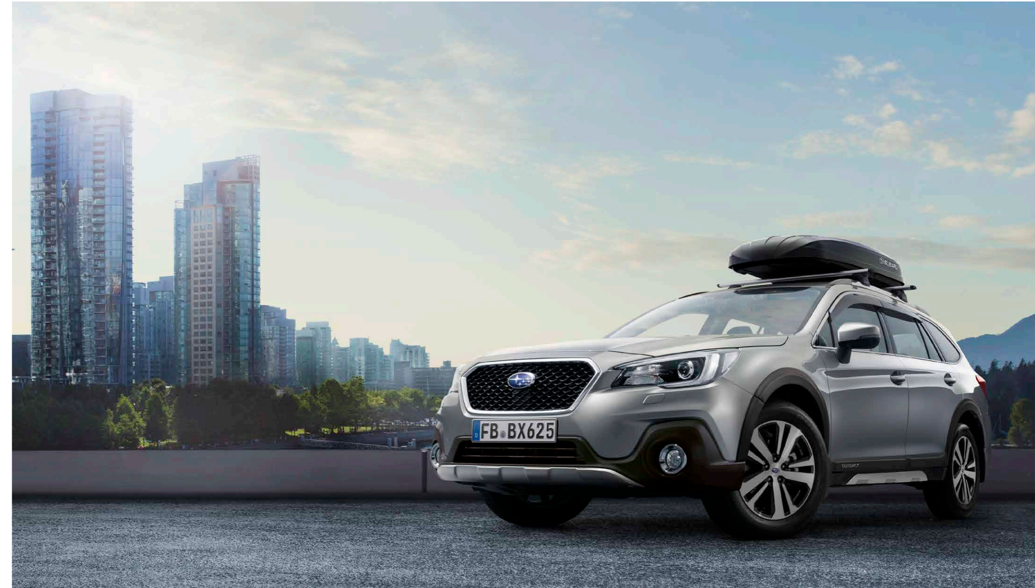
S. 9: Kunststofffrontblende Aluminiumoptik, Kunststoffseitenblendensatz Aluminiumoptik, Kotflügelverbreiterungssatz, Seitenwindabweisersatz, Gitterfrontgrill, Schmutzfängersätze vorne und hinten, Aluminium-Dachgrundträger C-Slot, Dachbox. 9