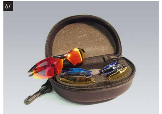
67 SUBARU Sonnenbrillenset 1343 Sportliche Sonnenbrille mit austauschbaren Scheiben. Inhalt 5 Paar Brillengläser in den Farben rauch, klar, blau, gelb und rot. Brille mit Beutel Brillenputztuch im Etui. UV 400.