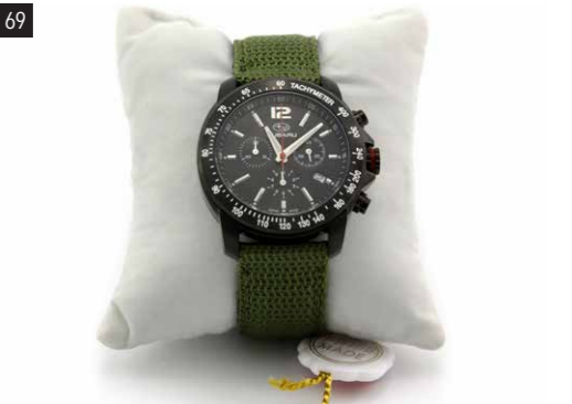
69 SUBARU Quarz-Chronograph 1573 Swiss Made. Massives Edelstahlgehäuse (Ø 42 mm) PVD beschichtet. Mineralglas. Wasserdicht bis 100 Meter. SWISS Made Uhrwerk Ronda 5040.D. Nylonarmband grün. Lieferung in hochwertiger Kunstlederbox. Limitierte Auflage von 50 Stück.