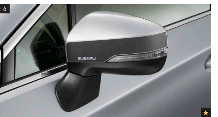
6 Dekorfolien für Außenspiegel Schwarz SEZNFL3100 Verleiht den Außenspiegeln einen ganz neuen Look.