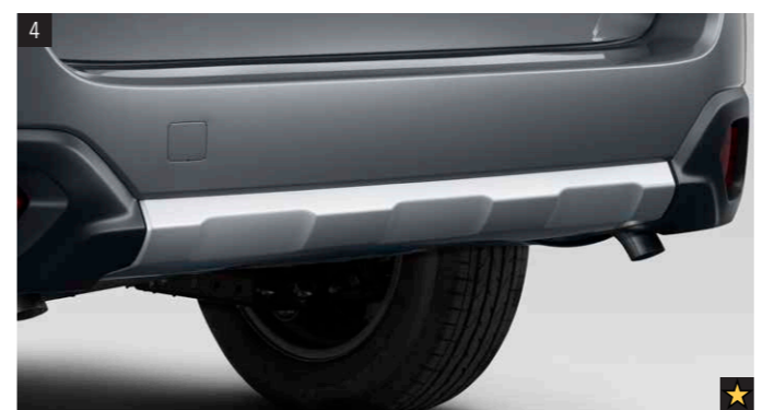
4 Kunststoffheckklende Aluminiumoptik SEFHAL3100 Zum Schutz des Fahrzeugs vor Steinschlag. Verstärkt die Offroad-Optik.