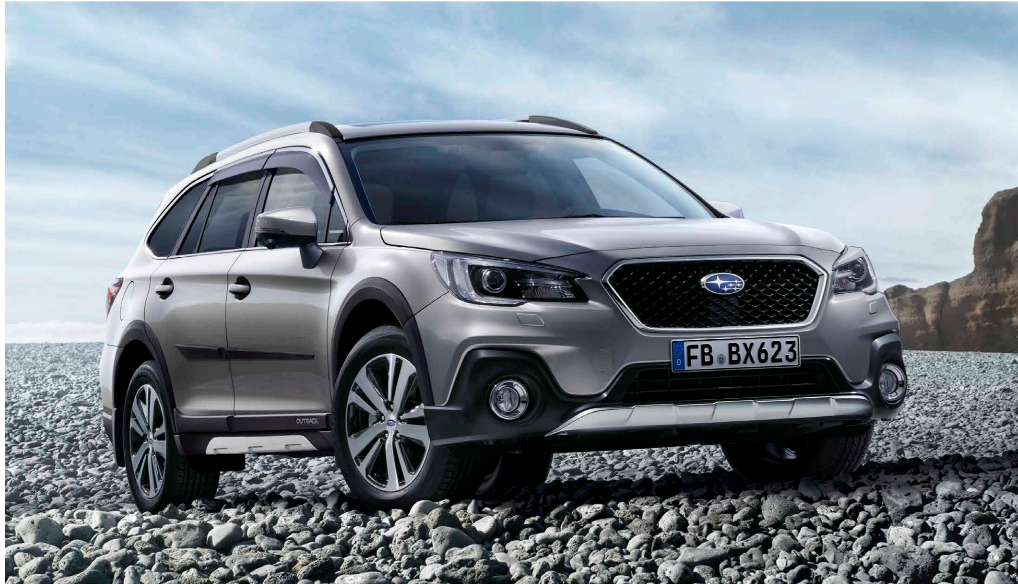
1 Gitterfrontgrill J1010AL310 Das Gittermaschendesign verleiht der Front ein ganz neues Aussehen.