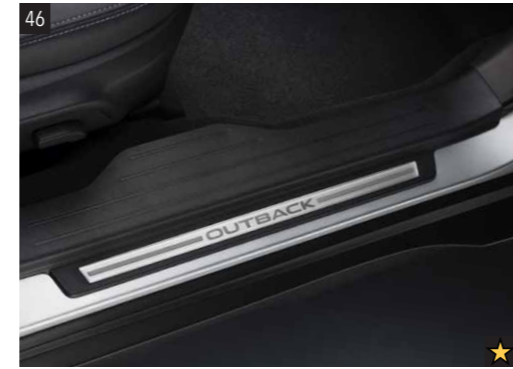
46 Türeinstiegsleistensatz, klein SEBDAJ1111 Elegante Zierleisten mit Schriftzug - betont den Türeinstieg. *Set mit 4 Einsätzen