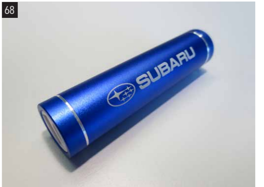
68 SUBARU Power Bank 1510-01 Auch wenn weit und breit keine Steckdose zur Verfügung steht kann damit ein Handy bequem geladen werden. Kapazität: 5.200 mAh, Lithium Ionen Akku.