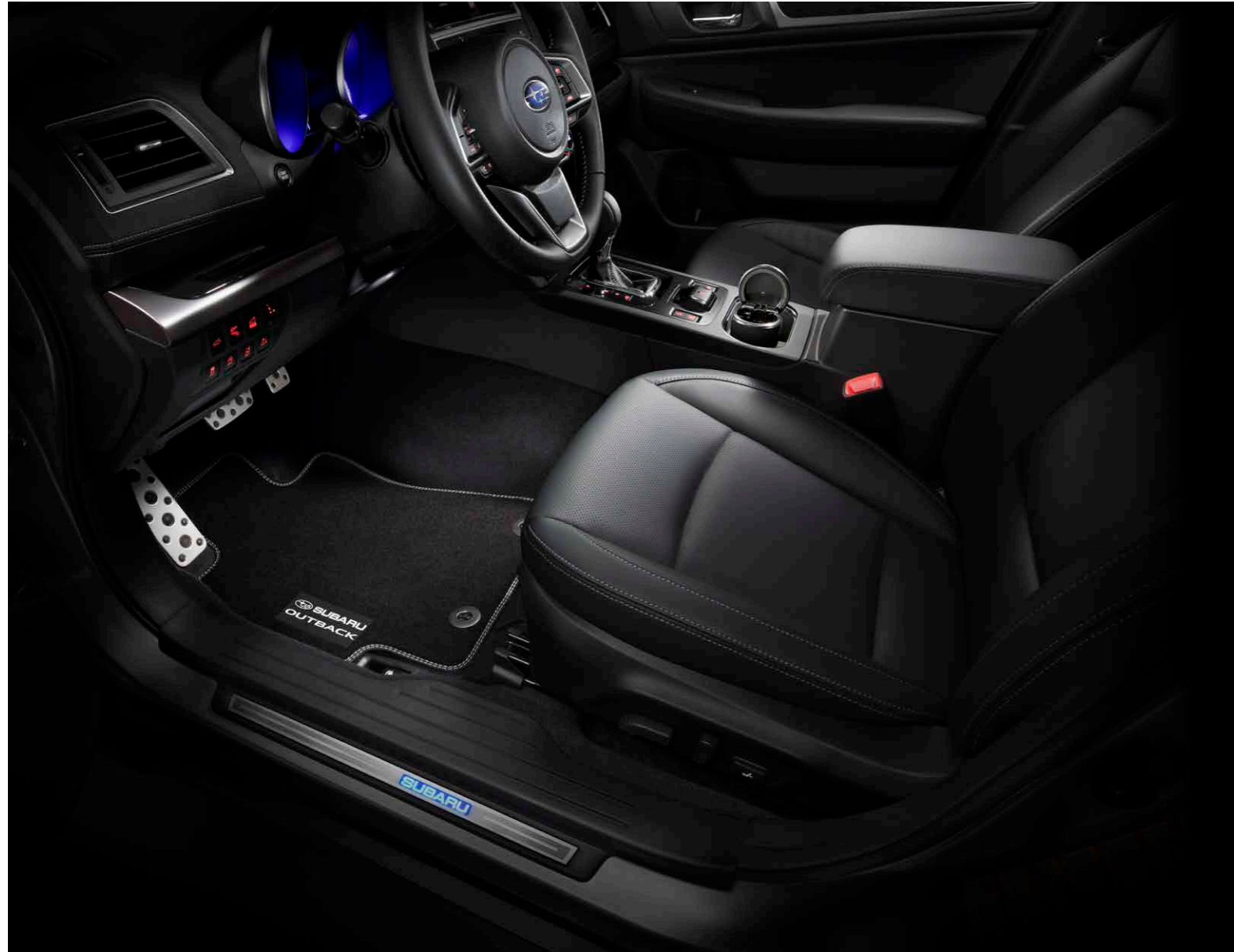
45 Türeinstiegsleistensatz beleuchtet H101CAL000ES Hochwertige Einstiegsleisten aus Edelstahl mit beleuchtetem Subaru Logo. *2-teiliges Set für vorne.