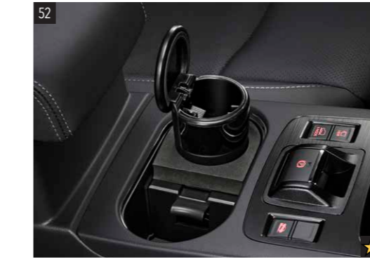
52 Aschenbecher (für Getränkehalter) 92172AG040 Praktisch austauschbarer Aschenbecher. Passt in den Getränkehalter der Mittelkonsole.