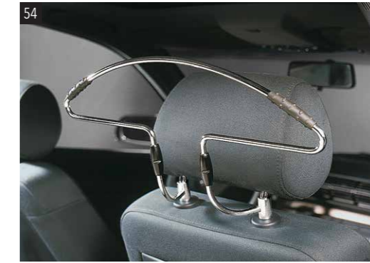
54 Autokleiderbügel zur Kopfstützenmontage 2405 Zum Aufhängen von Kleidungsstücken. *Montage an der Kopfstütze.