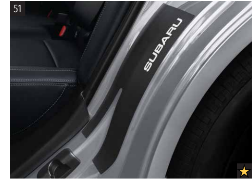
51 Schutzfolie für den Heckeneinstiegsbereich SEBDAL3100 Robuste Folie zum Schutz des hinteren Einstiegsbereichs vor Kratzern.