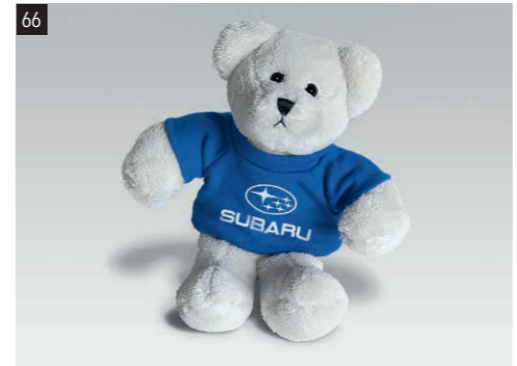
66 SUBARU ÖKO - Tex Plüschbär 2921 Flauschiger Teddy im T-Shirt zum Knuddeln.