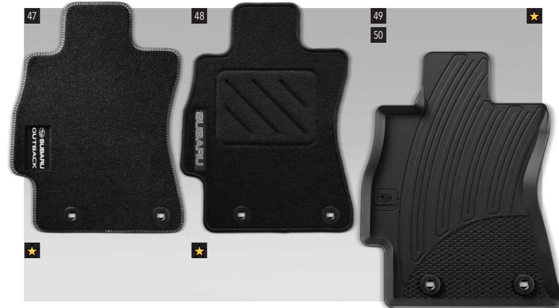
47 Teppichmattensatz vorne & hinten, Premium J505EAL200 Verbessern Sie das Erscheinungsbild des Innenraums mit hochwertigen, passgenauen Teppichmatten mit Schriftzug.