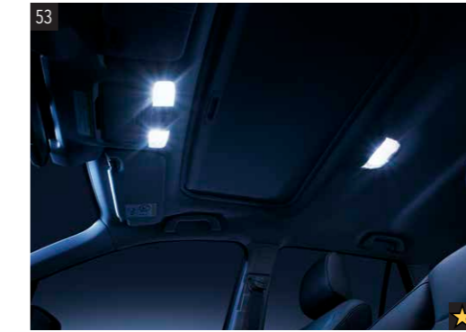
53 LED Innenbeleuchtung SEHAAL1000 Ersetzt die Birnen der Innenraumbeleuchtung. Verändert die Farbtemperatur zu einem kühleren, weißen Licht für mehr Komfort und geringeren elektrischen Verbrauch.