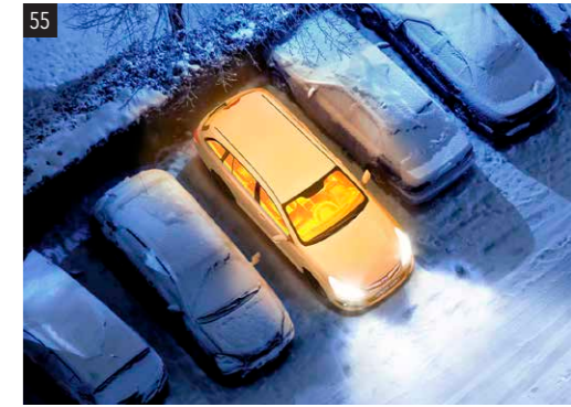
55 Standheizung Auf Anfrage Heizt den Motor vor und wärmt den Innenraum. Bitte fragen Sie Ihren Subaru Partner nach den Details.