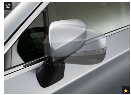
62 Außenspiegelanklappautomatik-Modul SEECAL3100 Dieses Elektronikmodul sorgt dafür, dass die Außenspiegel automatisch angeklappt werden, sobald das Fahrzeug verschlossen wird. Ebenso automatisch werden sie wieder ausgeklappt, wenn die Zündung erneut eingeschaltet wird.