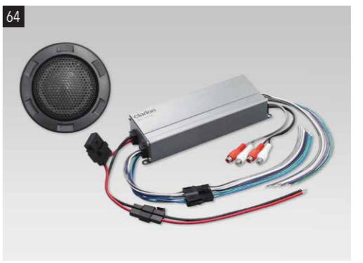
64 Sound Upgrade „Basic“ 1290-40 Plug & Play Soundupgrade Lösung, mit passgenauem Kabelsatz und Integrierter Frequenzweiche. Digitaler ClassD 4 Kanal Verstärker, MOSFET Technik für brillanten Klang, RMS Ausgangsleistung an 4 Ohm = 4 x 50 Watt, max. Ausgangsleistung 300 Watt. Audiophile 25mm High End Hochtöner mit TETOLON Schwingspule und spielreudigem NEODYM Magnet. *Nicht für Fahrzeuge mit Harman-Kardon-System.