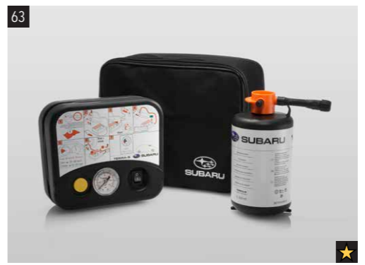
63 Reifenpannenset SETSYA4001 Bedienungsfreundlicher, kompakter Reparatur-Kit mit Spezialdichtmittel und Mini-Kompressor.