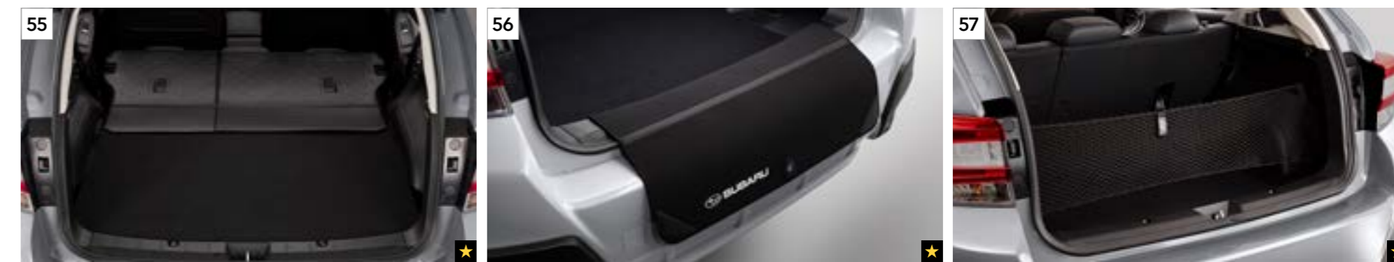
55 Rücksitzlehenschutz J501EFL200 Schützt die Rückenlehnen von der Laderaumseite her, wenn diese umgelegt sind.