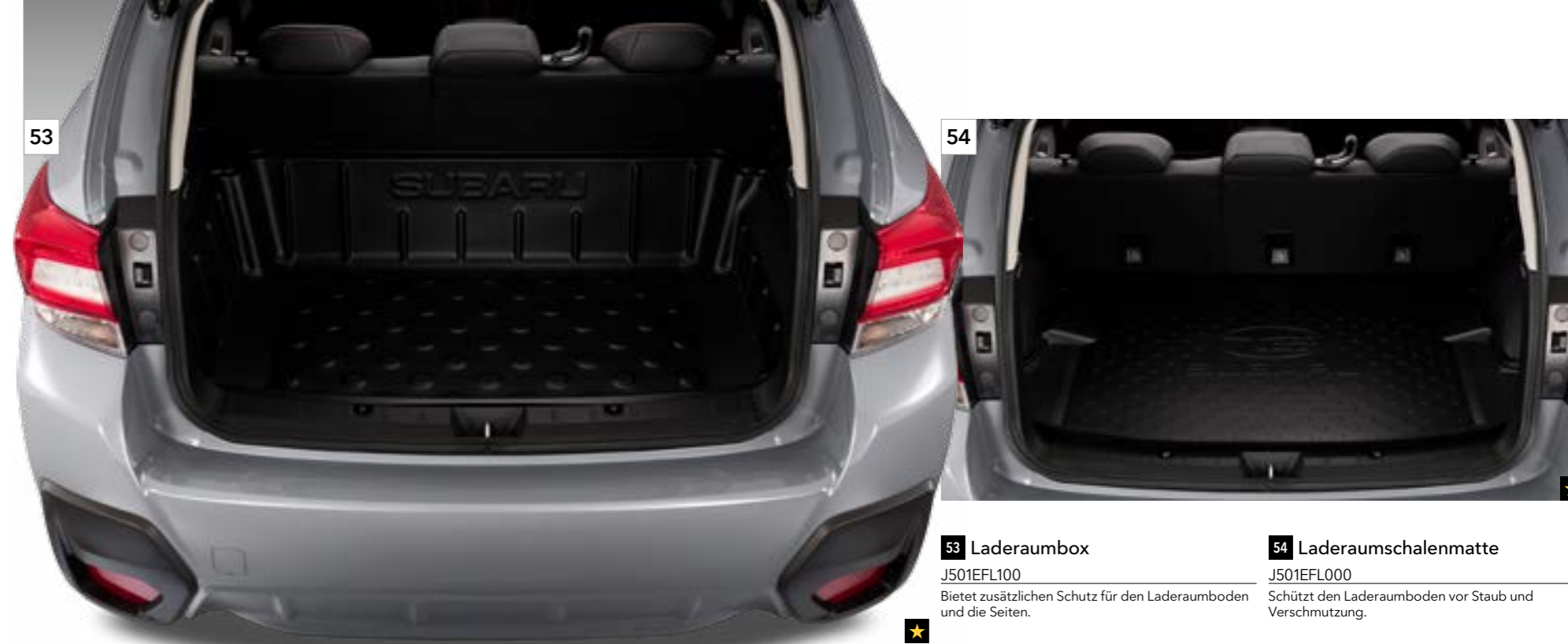
53 Laderaumbox J501EFL100 Bietet zusätzlichen Schutz für den Laderaumboden und die Seiten.