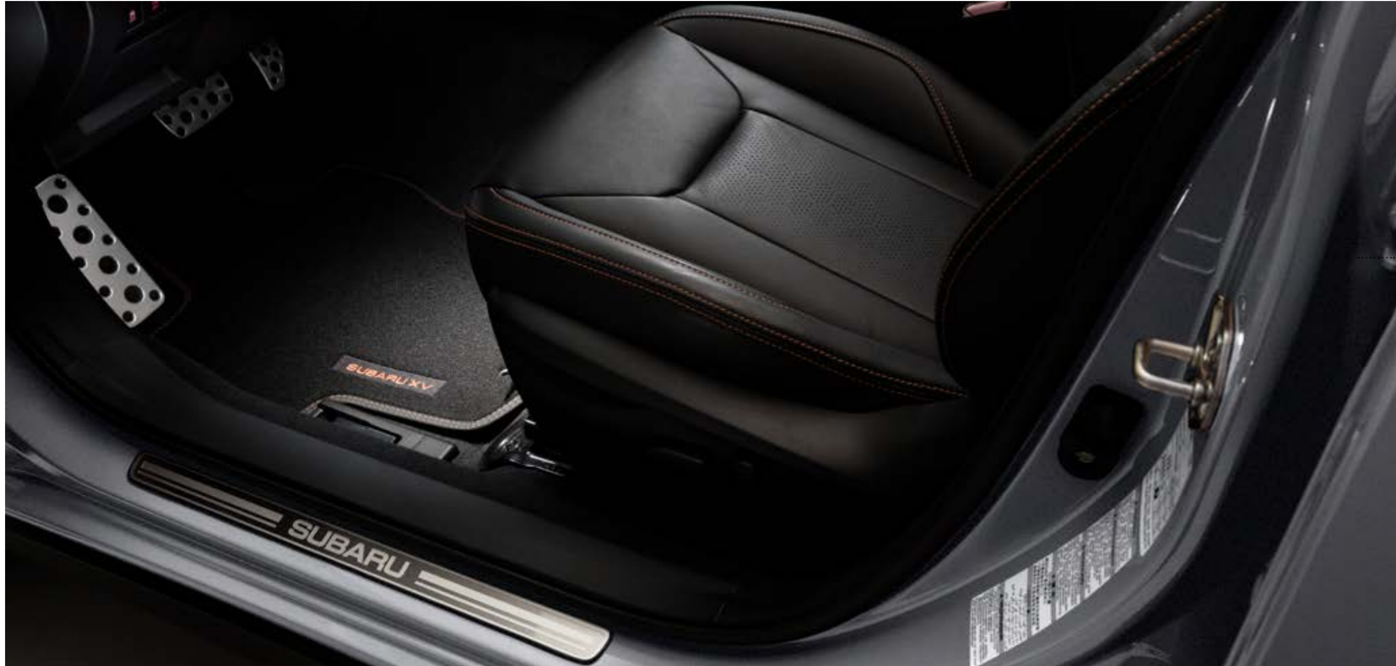
S. 14: Teppichmattensatz vorn und hinten Premium, Türeinstiegsleistensatz Edelstahl.

★Alle Artikel, die mit diesem Symbol gekennzeichnet sind, können zu Preisvorteilspaketen zusammengefasst werden. Siehe Preisliste auf Seite 22/23 und Rückseite. Die Preise der jeweiligen Artikel entnehmen Sie bitte der Preisliste auf Seite 22/23. Die Preise verstehen sich zuzüglich Montage und eventuell notwendiger Lackierarbeiten sowie TÜV-Kosten.