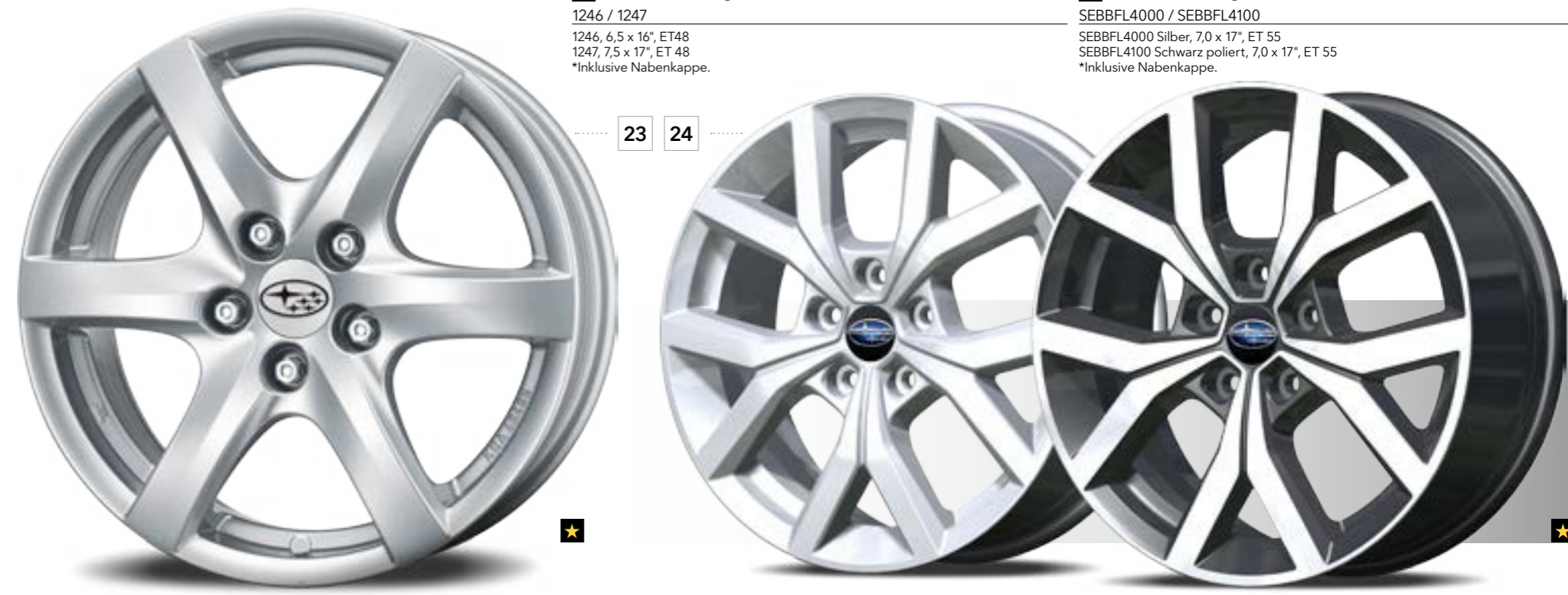
24 Leichtmetallfelge 7,0 x 17", ET 55 SEBBFL4000 / SEBBFL4100 SEBBFL4000 Silber, 7,0 x 17", ET 55 SEBBFL4100 Schwarz poliert, 7,0 x 17", ET 55 *Inklusive Nabenkappe.