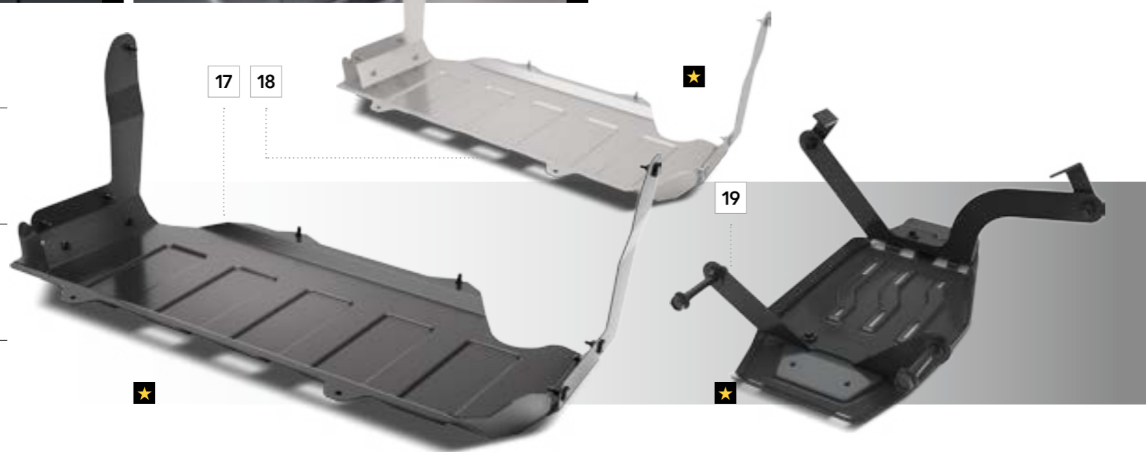
19 Differenzialschutz hinten E515EFL200 Schützt die Unterseite des hinteren Differenzials vor Steinen. *Voraussichtlich verfügbar ab Frühjahr 2018.