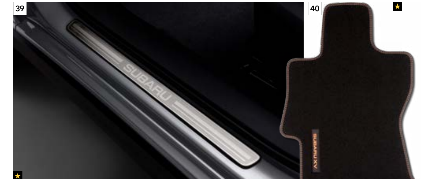
39 Türeinstiegsleistensatz Edelstahl E1010FJ100

Jede Reise beginnt im Inneren. Deshalb bieten wir Ihnen ein umfangreiches Interieur- und Laderaum-Zubehörprogramm. Fühlen Sie sich auf der Straße zu Hause.