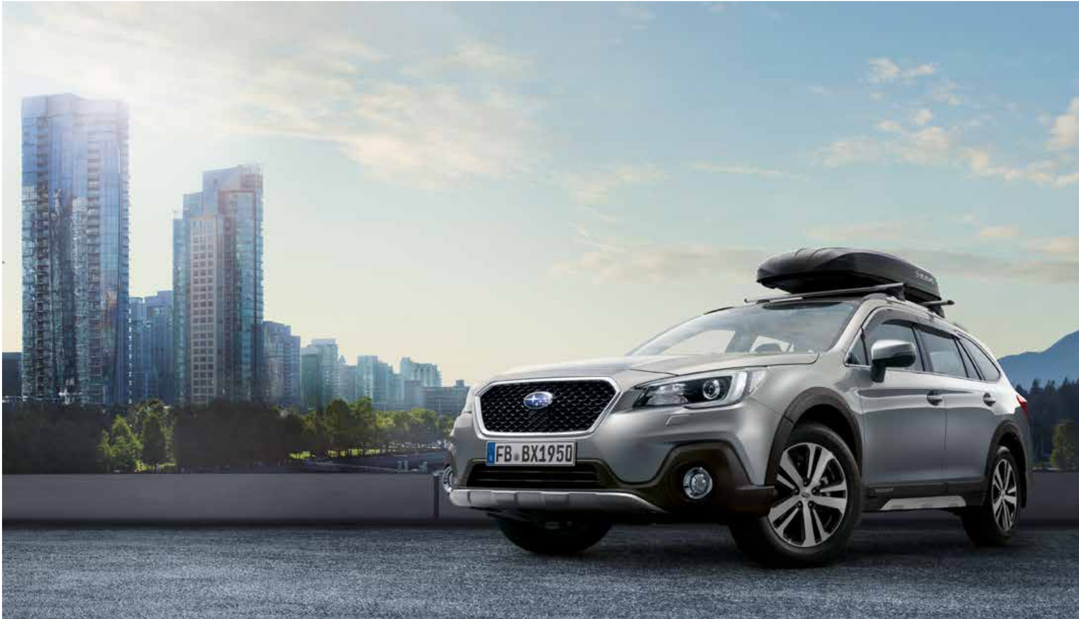
S. 9: Kunststofffrontblende Aluminiumoptik, Kunststoffseitenblendensatz Aluminiumoptik, Kotflügelverbreiterungssatz, Seitenwindabweisersatz, Gitterfrontgrill, Schmutzfängersätze vorne und hinten, Aluminium-Dachgrundträger C-Slot, Dachbox. 9