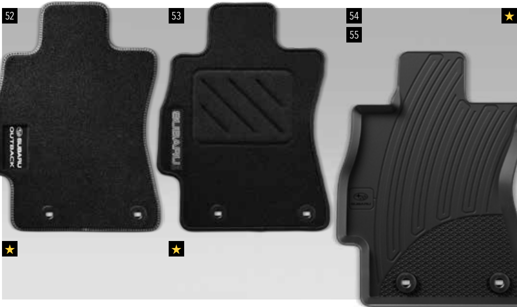
52 ★ Teppichmattensatz vorne & hinten, Premium 53 ★ Teppichmattensatz vorne & hinten, Standard 54 ★ Gummimattensatz vorne 55 Gummimattensatz hinten

52 Teppichmattensatz vorne & hinten, Premium J505EAL200 Verbessern Sie das Erscheinungsbild des Innenraums mit hochwertigen, passgenauen Teppichmatten mit Schriftzug. 53 Teppichmattensatz vorne & hinten, Standard J505EAL100 Teppichmatte mit Schriftzug, genaue Passform. 54 Gummimattensatz vorne J505EAL010 55 Gummimattensatz hinten J505EAL020 Strapazierfähige Gummimatte. Schützt den Boden vor Matsch und Schnee.