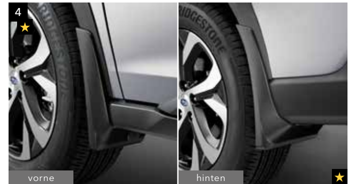
4 Schmutzfängersatz vorne & hinten

Zum Schutz des Fahrzeugs vor Steinschlag. Verstärkt die Offroad-Optik. *8x Clip Artikelnummer 91085TA030 zur Montage zusätzlich notwendig.