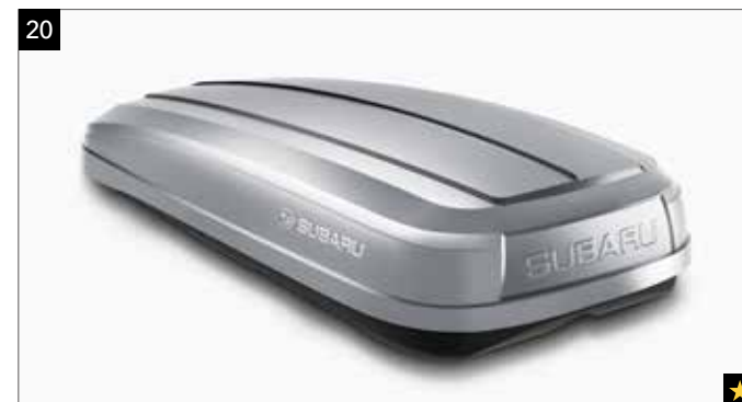
20 Dachbox (kurz, Silber)