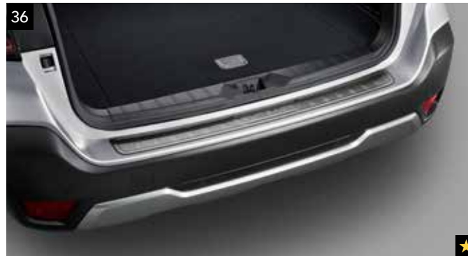
36 Stoßfängerschutzleiste (Edelstahl)

Robuste Kunststoffabdeckungen zum Schutz der Oberseite des hinteren Stoßfängers vor Kratzern beim Be- und Entladen.