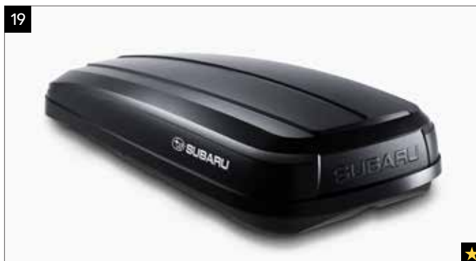
19 Dachbox (kurz, Schwarz)