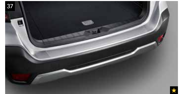
37 Stoßfängerschutzfolie (transparent)

Leiste aus Edelstahl zum Schutz der Oberseite des hinteren Stoßfängers vor Kratzern beim Be- und Entladen.