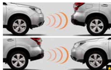
75 Ultraschall Einparkhilfen für vorne und hinten H485ESG100/H485ESG200/H485ESG000

Praktisch austauschbarer Aschenbecher. Passt in den Getränkehalter der Mittelkonsole.