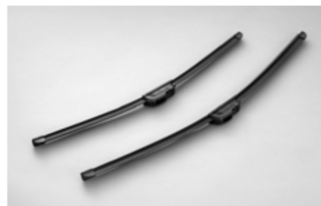
4 Premium Scheibenwischer "Aeroblades" SEBOSG8000

Stilvoll integrierbare LED Leuchten für mehr Sicherheit am Tag und zur optischen Aufwertung der Fahrzeugfront. *Lackierung erforderlich. Nicht für 2.0XT und 2.0D Sport.