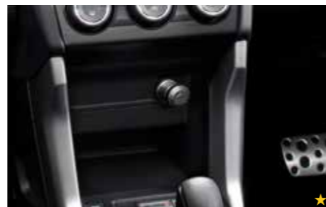
73 Zigarettenanzünder-Kit H6710SG000

*Xenon- und LED-Leuchtmittel nicht enthalten. Inhalt kann von der Abbildung abweichen.