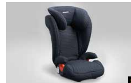
80 Kindersitz SUBARU Junior Plus F410EYA214