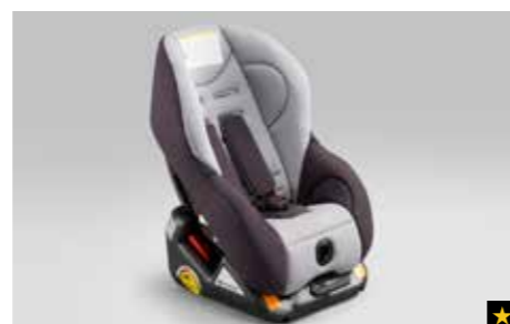
76 Kindersitz SUBARU G0/1S ISOFIX F410EYA012

Sicheres Einparken mit jeweils vier Sensoren durch akustische Warnungen.