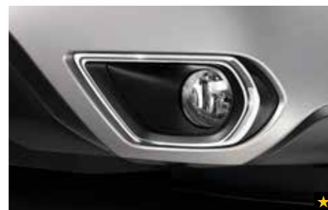
2 Chromzierleisten für die Nebelscheinwerfer J105ESG000

Das Gittermaschendesign aus Kunststoff verleiht der Front ein ganz neues Aussehen.