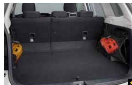
62 Gepäcknetz (Seite) F551SSG010 Entlang der Laderaumseite zur Aufbewahrung von Kleinteilen. * Set mit 2 Netzen