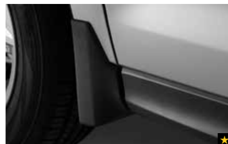
11 Schmutzfängersatz vorne J1010SG251MC

Betont die Heckklappe durch die elegante, attraktive Chromzierleiste.