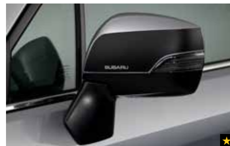
5 Dekorfolien für Außenspiegel Schwarz SEBDFJ3000

Aerodynamisches Design für bessere Performance. *Set mit 2 Scheibenwischerblättern.