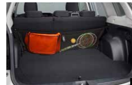
60 Gepäcknetz (Rückbank) F551SSG020 Kann über die gesamte Rückbank gezogen werden. Zur Aufbewahrung verschiedener Arten von Ladung/Gepäck.