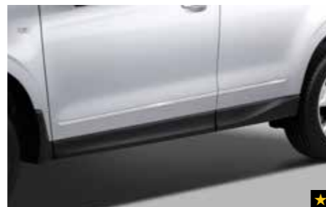
8 Chromzierleisten Seitentüren E755ESG100

Ermöglicht auch bei Regen und Schnee das Fahren mit leicht geöffnetem Fenster.