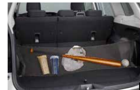
61 Gepäcknetz (Ladekante) F551SSG000 Zum Verstauen von Ladung. Verhindert das Herausfallen, wenn Heckklappe geöffnet ist.