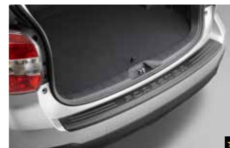
55 Stoßfängerschutzleiste (Kunststoff) E7710SG000 Zum Schutz des hinteren Stoßfängers vor Kratzern beim Ein- und Ausladen.