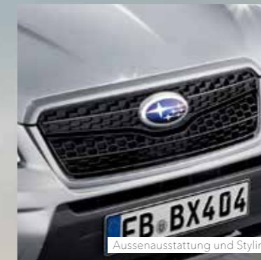
Aussenausstattung und Styling