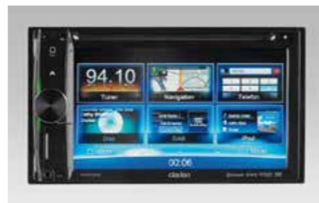
68 2DIN Multimediasystem Clarion NX502E 1290-01

Hochauflösende Kamera, die beim Einlegen des Rückwärtsgangs automatisch ein Bild des hinter dem Fahrzeug gelegenen Bereichs auf dem Monitor anzeigt. *Nur in Verbindung mit SEALFJ6000/SEALFJ6200 für 2.0X Trend und 2.0X/2.0D Active. Einbausatz erforderlich.