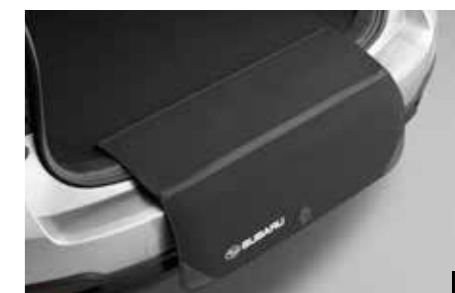
65 Textiler Ladekantenschutz E101EAJ500 Schützt die Ladekante und den Stoßfänger vor Kratzern beim Ein- und Ausladen.