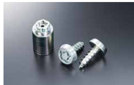
70 Navigationsschlossschraubensatz SEMGYA6000

Mit zusätzlichem Seitenaufprallschutz. Sichere Befestigung dank ISOFIX-System.