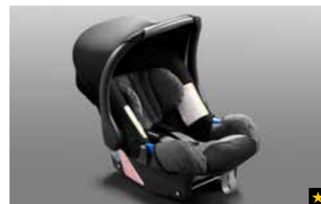
78 Kindersitz SUBARU Baby Safe Plus F410EYA104

2DIN DVD Multimedia-Navigationssystem mit hochauflösendem 7" Touch-Display. 44 Länder (Europa), DVB-T Empfänger, TMC, Bluetooth**2, Anschlussmöglichkeit für eigene Musikplayer und Mobiltelefone. *Einbaumaterial erforderlich.