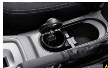
74 Aschenbecher (für Getränkehalter) F6010AG000

Praktisch austauschbarer Aschenbecher. Passt in den Getränkehalter der Mittelkonsole.