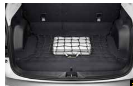
63 Gepäcknetz (Laderaumboden) F5510SC000 Verhindert das Verrutschen der Ladung/des Gepäcks während des Fahrens.