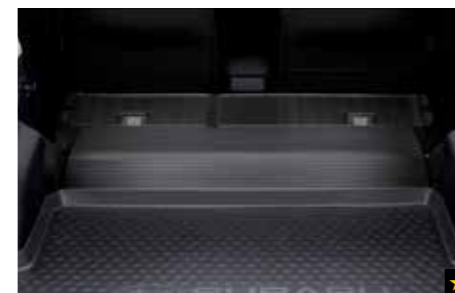
59 Rücksitzlehenschutz J515ESG200 Schützt die Rückenlehne vom Laderaum her. * In Verbindung mit Laderaumschalenmatte verwendbar.