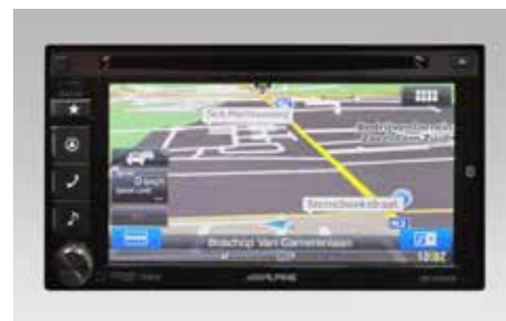
66 Navigationssystem Alpine/Navigationssystem Alpine + DAB SEALFJ6000/SEALFJ6200

6,1" WVGA Touch-Display, iPod*1 und USB Musik-/Videowiedergabe, DVD/DivX/CD-R +/-RW kompatibel, 4 x 50W Verstärker, Bluetooth, MirrorLink™, abnehmbares Bedienteil, Text to Speech (TTS), TMC-Tuner, 46 Länder (Europa) 2D/3D Landkarten, 3D Stadtpläne.