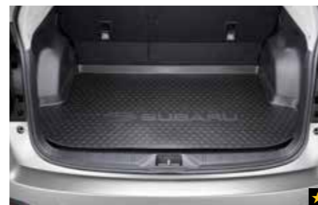
58 Laderaumschalenmatte J515ESG000 Schützt den Laderaumboden vor Staub und Verschmutzung.