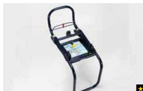
77 Kindersitz SUBARU G0/1S ISOFIX Plattform F410EYA910

Zur sicheren Befestigung unter Nutzung der ISOFIX-Haltepunkte. Verwendung mit F410EYA910.