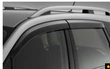
7 Seitenwindabweisersatz F0010SG700

Verleiht den Außenspiegeln einen völlig neuen Look. *Nicht für 2.0X Active und 2.0X Trend.