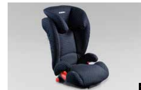
81 Kindersitz SUBARU ISOFIX Junior F410EYA215

Mit zusätzlichem Seitenaufprallschutz. Sichere Befestigung dank ISOFIX-System.