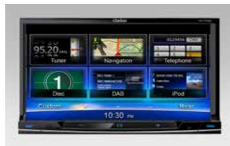
69 2DIN Multimediasystem Clarion NX702E 1290-02

2DIN DVD Multimedia-Navigationssystem mit hochauflösendem 6,2" Touch-Display. 44 Länder (Europa), TMC, Bluetooth**2, Anschlussmöglichkeit für eigene Musikplayer und Mobiltelefone. *Einbaumaterial erforderlich.