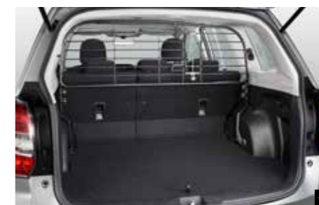
64 Laderaumtrenngitter F5510ESG000 Trennt den Laderaum vom Insassenbereich: Besonders für den Transport von Hunden geeignet.