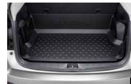
57 Laderaumbox J515ESG100 Bietet zusätzlichen Schutz für den Laderaumboden und die Seiten.