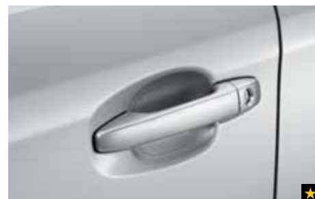
9 Griffmuldenschutzfolie SEZNF22000

Stilvolle Chromzierleisten setzen Akzente auf den Seitentüren.