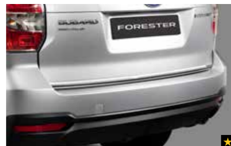
10 Chromzierleiste Heckklappe E755ESG000

Transparente Folie zum Schutz der Griffmulden vor Kratzern. *Set mit 2 Folien.