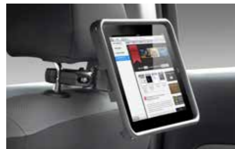
71 iPad**1 Halter zur Kopfstützenmontage SELUYA6000

Schutz vor Diebstahl. Die Spezialschrauben können nur mit dem codierten Adapter gelöst werden.