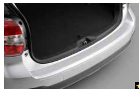
54 Stoßfängerschutzfolie (transparent) E775ESG100 Zum Schutz des hinteren Stoßfängers vor Kratzern beim Ein- und Ausladen.