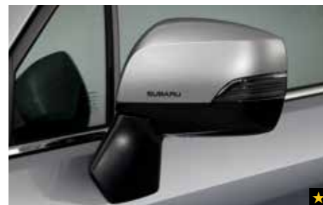
6 Dekorfolien für Außenspiegel Silber SEBDFJ3010

Verleiht den Außenspiegeln einen völlig neuen Look. *Nicht für 2.0X Active und 2.0X Trend.