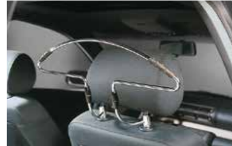
52 Autokleiderbügel zur Kopfstützenmontage 2405

Schützt den Fahrzeugboden vor Matsch und Schnee. * In Kombination mit Gummimattensatz vorne. Set für hinten.