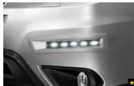
3 LED Tagfahrleuchten SENOSG3000

Zierleisten aus Edelstahl akzentuieren die Fahrzeugfront passend zu den anderen Chromteilen. *Nicht für 2.0XT und 2.0D Sport.