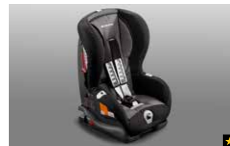
79 Kindersitz SUBARU Duo ISOFIX Plus F410EYA003