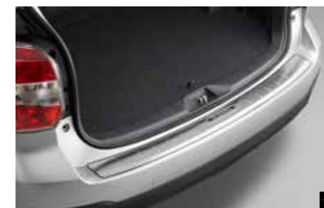
56 Stoßfängerschutzleiste (Edelstahl) E7710SG000 Zum Schutz des hinteren Stoßfängers vor Kratzern beim Ein- und Ausladen.