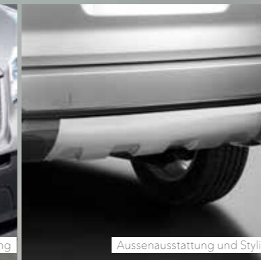
Aussenausstattung und Styling