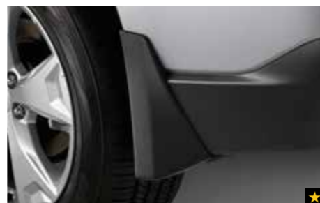
12 Schmutzfängersatz hinten J1010SG254MC

Verhindert, dass Matsch, Schnee, Teer, Steine usw. an die Karosserie gelangen.