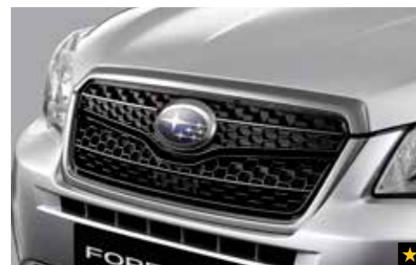
1 Gitterfrontgrill J1010SG100

Das Gittermaschendesign aus Kunststoff verleiht der Front ein ganz neues Aussehen.