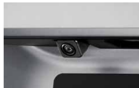
67 Rückfahrkamera 86267SG000

6,1" WVGA Touch-Display, iPod*1 und USB Musik-/Videowiedergabe, DVD/DivX/CD-R +/-RW kompatibel, 4 x 50W Verstärker, Bluetooth, MirrorLink™, abnehmbares Bedienteil, Text to Speech (TTS), TMC-Tuner, 46 Länder (Europa) 2D/3D Landkarten, 3D Stadtpläne.