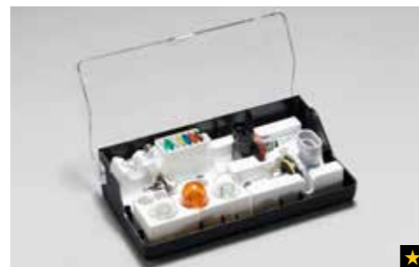
72 Reservelampenset (für Fahrzeuge mit und ohne Xenon-Scheinwerfer) SEHASG8000/SEHASG8010

Stabiler und verstellbarer Halter für das iPad zur Kopfstützenmontage.