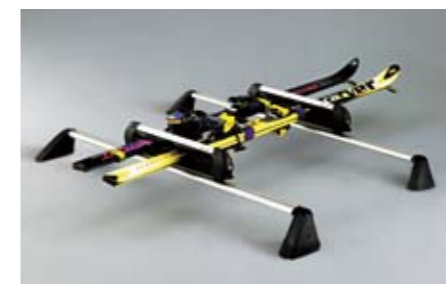
42 Skiaufsatz für 3 - 4 Paar Ski E361EAG500 ★W Für bis zu 4 Paar Ski oder 2 Snowboards. Nutzbare Breite 350 mm. *Dachgrundträger zusätzlich notwendig.