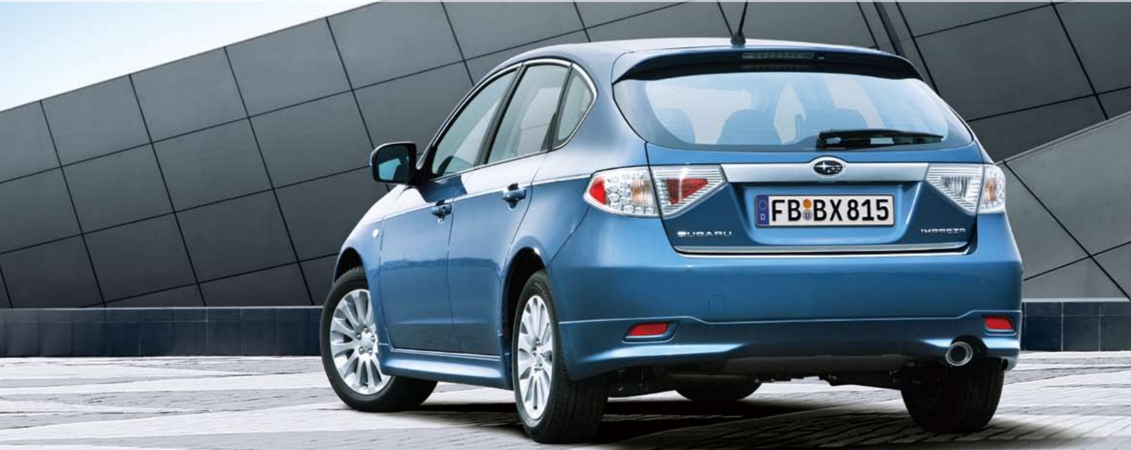
Das abgebildete Fahrzeug ist ausgestattet mit Sport-Frontschürze, Sport-Seitenschürzensatz, Sport-Heckschürze, Chromoptik-Zierleiste Seitenfenster, Chromoptik-Zierleiste Seitentüren, Chromoptik-Zierleiste Heckklappe.