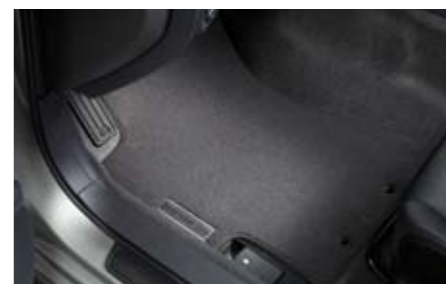
64 Teppichmattensatz vorne & hinten grau "Premium" J50SEFG200 ★ W Genaueste Passform, mit Logo. *für vorne und hinten.