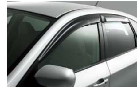
6 Seitenwindabweisersatz E3610FG000 ★W Ermöglicht auch bei Regen das Fahren mit leicht geöffnetem Fenster.