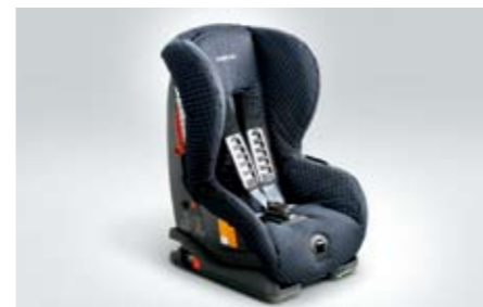
94 Kindersitz SUBARU DUO ISOFIX PLUS F410EYA002 ★ W Sichere Befestigung dank ISOFIX-System.