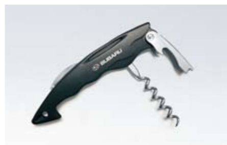
98 SUBARU Kellnermesser "Sharky" 2462 N Die elegante Art Weinflaschen zu öffnen.