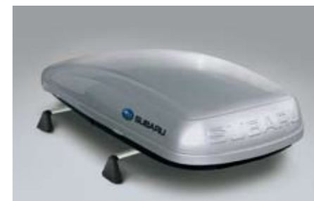
39 Dachbox (kurz) E361EYA801 ★W Abmessungen: 1.792 x 797 x 355 mm, Inhaltsvolumen: 380 Liter. *Dachgrundträger zusätzlich notwendig.