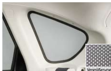
53 Sonnenschutzelemente für die Seitenscheiben Laderaum F50SEFG100 ★ W Zum Schutz des Laderaums vor starker Sonneneinstrahlung von der Seite. Maschenstruktur.