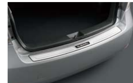
33 Stoßfängerschutzleiste Edelstahl E7710FG000 Zum Schutz vor Kratzern beim Einladen.