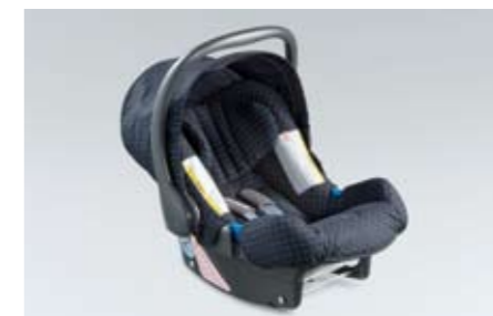
92 Kindersitz SUBARU BABYSAFE ISOFIX PLUS F410EYA103 ★ W Komplett mit Sonnenschutzdach. Sichere Befestigung dank ISOFIX-System.