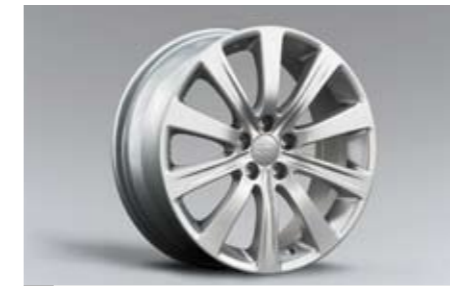
17 Alufelge 7,0 x 17\", ET 55 28111FG020 ★ W Nabenkappe zusätzlich notwendig.