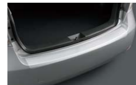
35 Stoßfängerschutzfolie transparent E775EFG100 Zum Schutz vor Kratzern beim Einladen.