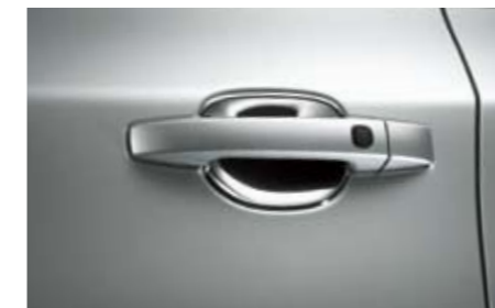
31 Griffmuldenschutz Chromoptik F0010FG050 Verchromte Abdeckungen für die Griffmulden. Schützen den Lack vor Kratzern.