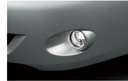
5 Nebelscheinwerfersatz H4510FG010 ★W Für deutlich bessere Sicht bei trübem Wetter.