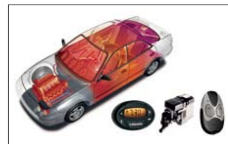
67 Standheizung In Vorbereitung N Heizt Motor und Innenraum vor, taut zugefrorene Scheiben auf.