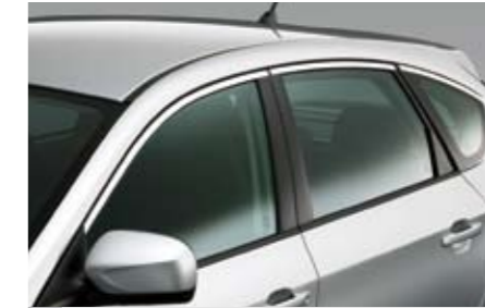
7 Chromoptik-Zierleiste Seitenfenster E755EFG100 ★W Ein eleganter Chrom-Touch für die Seitenscheibenkontur.