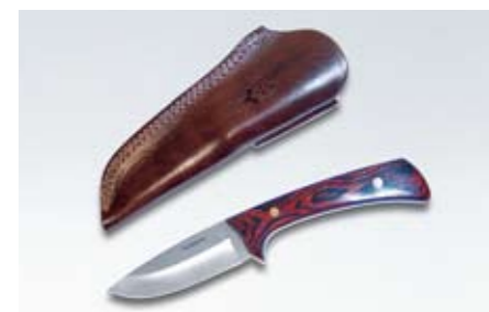
100 SUBARU Jagdmesser 9055 N Robuste Ausführung.