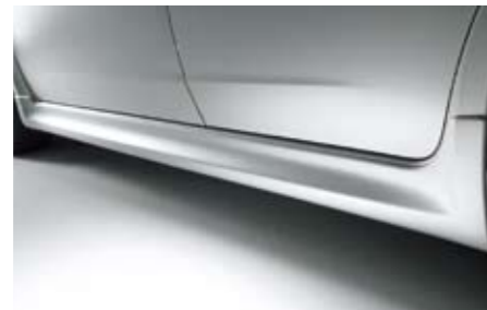
2 Sport-Seitenschürzensatz E2610FG00NN ★W Vermittelt einen sportlich-aggressiven Look. *Lackierung erforderlich.