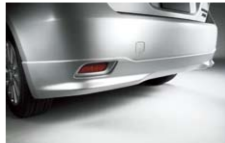
3 Sport-Heckschürze E5610FG00NN ★W Vermittelt einen sportlich-aggressiven Look. *Lackierung erforderlich.