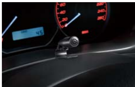
87 Zusatzmikrofon zu AV-Navigation H0018FG300 ★ W Mit Hilfe dieses Mikrofons wird die Bluetoothfreisprechfunktion der AV-Navigation H001EFG000 aktiviert. *Nur in Verbindung mit AV-Navigation H001EFG000 nutzbar.