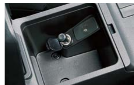
74 Zigarettenanzünder-Kit H6710FG000 ★W Zigarettenanzünder mit spezieller Steckdose.