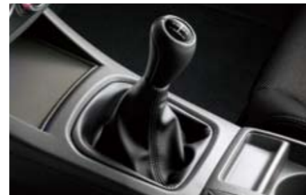
69 Lederschaltknauf (5-Gang) 35022AG000 ★W Ein eleganter Touch aus weichem Leder.