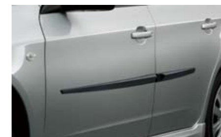
32 Seitenschutzleistensatz 4-teilig J105EFG100 Zum Schutz der Türen vor Parkschäden.