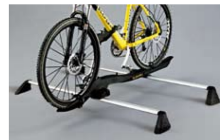
44 Fahrradaufsatz "Barracuda" E361ESA501 ★W Mit aerodynamischem Design, einfache Fahrradbefestigung. *Dachgrundträger zusätzlich notwendig.