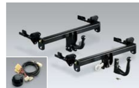
49 Anhängerkupplung (abnehmbar, starr) Siehe Übersicht auf Seite 18 ★W Löst Ihre Transportaufgaben. *Elektroeinbausatz zusätzlich notwendig.