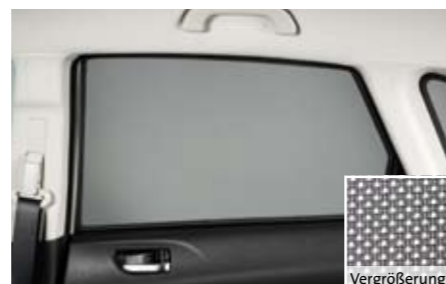
52 Sonnenschutzelemente für die hinteren Seitentüren F50SEFG200 ★ W Zum Schutz vor starker Sonneneinstrahlung von der Seite. Maschenstruktur.