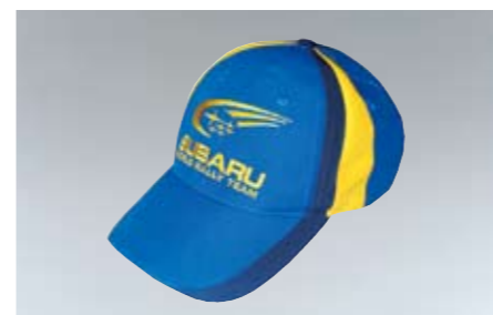
97 Baseball Cap "WRC-Team" WRC-205 N Sportliche Optik.