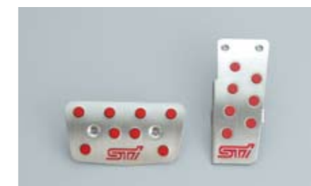
81 STI, Aluminium-Pedalset (Automatik) C8110AG010 ★W Für einen sportlichen Look.

★ Alle Artikel, die mit diesem Symbol gekennzeichnet sind, können zu Preisvorteilspaketen zusammengefasst werden. Siehe Preisliste auf Seite 18/19.