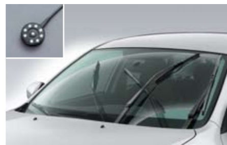
50 Regensensor SEWAYA8000 ★ E Aktiviert die Scheibenwischer, sobald Regen auf die Scheibe fällt. *Mit beleuchtetem Schalter zum Aktivieren/Deaktivieren.