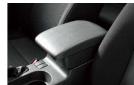
76 Mittelarmstützenerhöhung J2010FG000MG ★W Mit zusätzlichem Stauraum in der Mittelarmstütze.