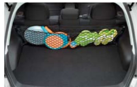
60 Gepäcknetz (Rückbank) F551SFG200 ★ W Sicherheit für das Transportgut und bessere Ordnung im Laderaum.