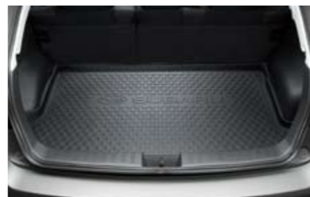
56 Laderaum-Schalenmatte J515EFG000 ★ W Schützt den Laderaum vor Verschmutzung.