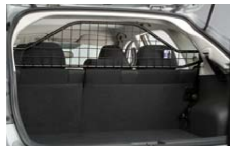
55 Laderaumtrenngitter F55SEFG000 ★ W Trennt den Laderaum vom Insassenbereich.