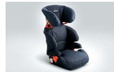
96 Kindersitz SUBARU JUNIOR PLUS F410EYA212 ★ W Mit gutem Schutz bei Seitenaufprall.