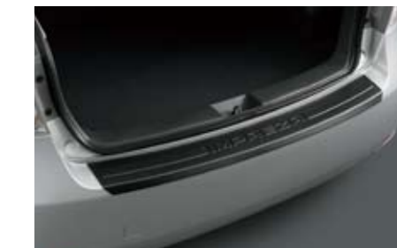
34 Stoßfängerschutzleiste Kunststoff E775EFG000 Zum Schutz vor Kratzern beim Einladen.