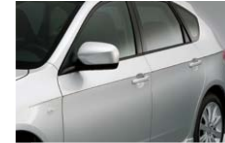
8 Chromoptik-Zierleiste Seitentüren E755EFG200 ★W Ein eleganter Chrom-Touch für die Seitentüren.