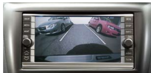
89 Rückfahrkamera H0010FG000 W Die hochauflösende Rückfahrkamera bietet bei Einlegen des Rückwärtsganges uneingeschränkte Hecksicht und optimalen Überblick beim Einparken. *Nur in Verbindung mit AV-Navigation H001EFG000 nutzbar.