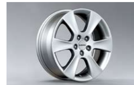
23 Alufelge 6,5 x 16\", ET 48 SECWAG4001 ★ E Nabenkappe zusätzlich notwendig.