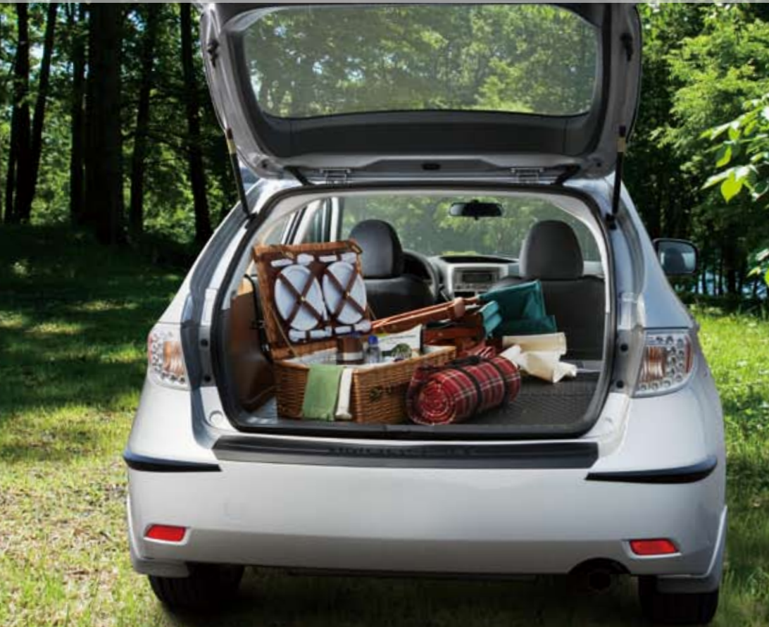
Das abgebildete Fahrzeug ist ausgestattet mit Stoßfängerschutzlack, Schmutzfängersatz, Stoßfängerschutzleiste Kunststoff, Laderaumschalenmatte faltbar.