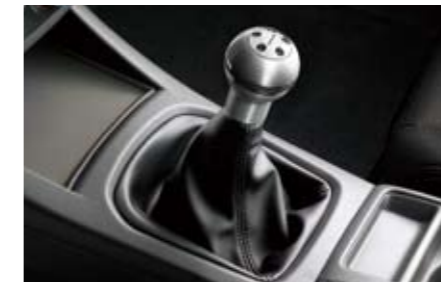
71 Aluminium Sportschaltknauf (5-Gang) C105EFE000 ★W Ein sportlicher Touch. Mit Subaru Logo.