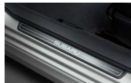
63 Türeinstiegsleistensatz E1010FG000 ★ W Ersetzt die serienmäßigen Einstiegsleisten, vermittelt einen dynamischen Look. *für vorne und hinten.