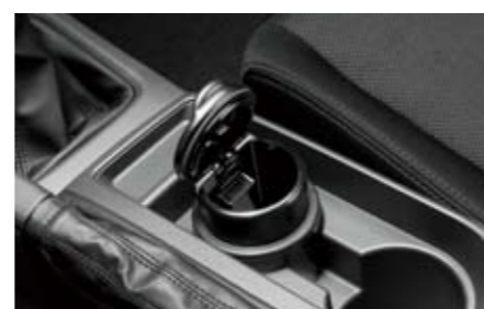
75 Aschenbecher für Getränkehalter F6010FG000 ★W Passt in den Getränkehalter der Mittelkonsole.