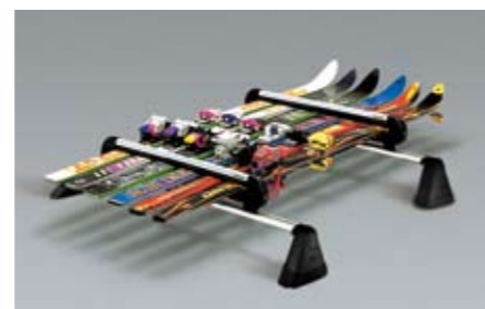
41 Skiaufsatz für 5 - 6 Paar Ski E361EAG550 ★W Für bis zu 6 Paar Ski oder bis zu 4 Snowboards. Nutzbare Breite 640 mm. *Dachgrundträger zusätzlich notwendig.