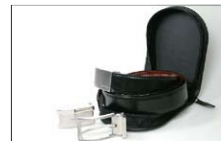
99 Wendegürtel "Reise Set" 2585 N Farben Schwarz und Cognac, mit 3 Wechselschließen.