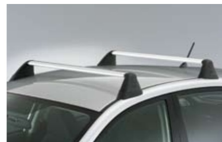
36 Dachgrundträger C-Slot E3610FG500 ★W Perfekt in Design und Funktion, zur Montage von Spezialträgern.