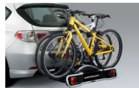
45 Fahrradaufsatz für Anhängerkupplung, System Thule (für 2 Räder) E365EFG700 ★W Zum Transport von 2 Fahrrädern. *Anhängerkupplung und E-Satz 13-polig zusätzlich notwendig.

★ Alle Artikel, die mit diesem Symbol gekennzeichnet sind, können zu Preisvorteilspaketen zusammengefasst werden. Siehe Preisliste auf Seite 18/19. Das abgebildete Fahrzeug ist ausgestattet mit Sport-Frontschürze, Sport-Seitenschürzensatz, Sport-Heckschürze, Gitterfrontgrill, Chromoptik-Zierleiste Seitenfenster, Chromoptik-Zierleiste Seitentüren, Dachgrundträger C-Slot, Dachbox.