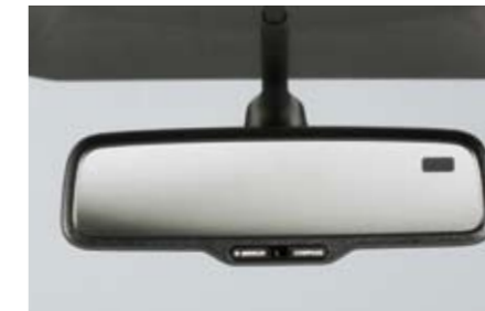
72 Selbstabblendender Innenspiegel mit Kompass H501SFG000 ★W Dunkelt bei Lichteinfall von hinten automatisch ab. Enthält einen elektronischen Kompass. *Adapterkit zur Montage zusätzlich notwendig.