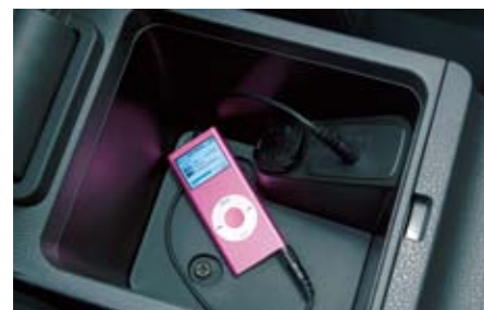
82 AUX-IN Anschluss H6210FG000 W 3,5 mm Stereo-Buchse, die den Anschluss von portablen Musik-Playern ermöglicht. Genießen Sie Ihre Musik über die Bordlautsprecher. *Für serienmäßiges 1fach-CD-Radio.