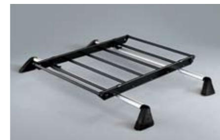
37 Gepäckkorbaufsatz E361EAG700 ★W Erweitert die Lademöglichkeiten deutlich. *Dachgrundträger zusätzlich notwendig.