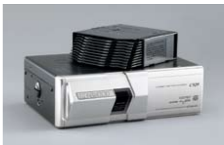
85 CD-Wechsler / AV-Ablage H621EAG000 / H6210FG900 W 10fach CD-Wechsler. *H6210FG900: AV-Ablage für 10fach CD-Wechsler.