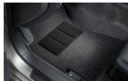
65 Teppichmattensatz vorne & hinten grau "Standard" J50SEFG100 ★ W Genaueste Passform. *für vorne und hinten.