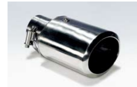
13 Edelstahlauspuffblende "Oval" 2022 ★N Ein sportliches Detail mit auffälliger Wirkung.