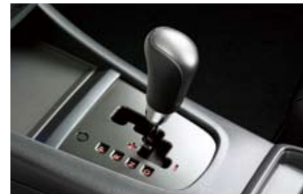
68 Lederschaltknauf (Automatik) 35160FG010JC ★W Ein eleganter Touch aus weichem Leder.