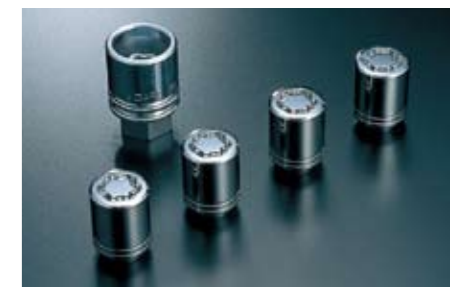
27 Felgenschlossatz B327EYA000 ★ W Diebstahlschutz für Ihre Felgen und Reifen.