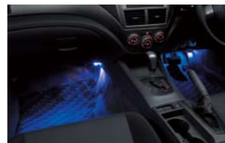
62 Fußraumbeleuchtung Fahrer- und Beifahrerseite H7010FG000 ★ W Automatische Aktivierung bei Öffnen der Fronttür, für bessere Sicht beim Ein- und Aussteigen.