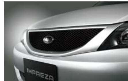
4 Gitterfrontgrill J1010FG100NN ★W Maschengittereinsatz, der die Front markant verändert. *Lackierung erforderlich.