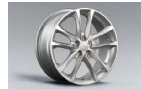
16 Alufelge 7,0 x 17\", ET 55 B3110FG100 ★ W Nabenkappe zusätzlich notwendig.