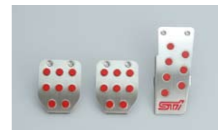
80 STI, Aluminium-Pedalset (Schaltgetriebe) C8110AG000 ★W Für einen sportlichen Look.

FHI und STI haben in Zusammenarbeit das Konzept des "Total Tuning" entwickelt, um die Leistung des Fahrzeugs zu betonen.