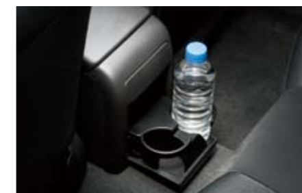
77 Getränkehalter hinten J2010FG010MG ★W Getränkehalter, der genau in den hinteren Teil der Mittelkonsole passt.