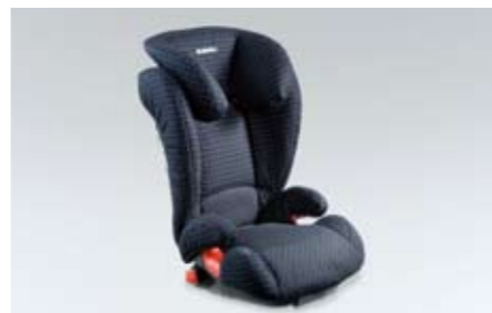
95 Kindersitz SUBARU JUNIOR ISOFIX PLUS F410EYA213 ★ W Sichere Befestigung dank ISOFIX-System. Mit gutem Schutz bei Seitenaufprall.