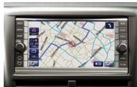
86 AV-Navigationssystem H001EFG000 W Exklusives Design, benutzerfreundliche Bedienung per Touch Screen und einfacher Zieleingabe. Inklusive Radio, CD- und DVD-Spieler. Bluetooth Freisprechfunktion vorbereitet. *DVD "Europa" 86283FG010 zusätzlich notwendig.