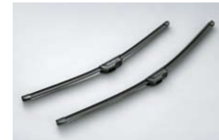
15 Premium Scheibenwischer "Aeroblades" SEBOFG8000 E Aerodynamisches Design für bessere Performance.