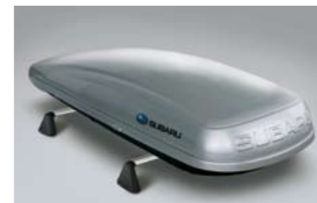
38 Dachbox (lang) E361EYA900 ★W Abmessungen: 2.267 x 805 x 355 mm, Inhaltsvolumen: 430 Liter. *Dachgrundträger zusätzlich notwendig.