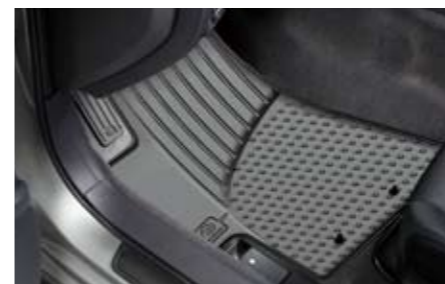
66 Gummimattensatz vorne & hinten J50SEFG000 ★ W Strapazierfähiger Gummimattensatz, der den Boden vor Schmutz und Schnee schützt. *für vorne und hinten.