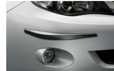
28 Stoßfängerschutzsteckensatz vorne & hinten J105EFG000 Ein wirksamer Schutz bei leichten Berührungen.