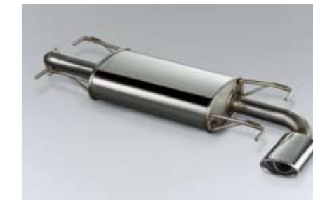
12 Sport-Endschalldämpfer SEREFG5000 ★E Verstärkt den sportlichen Auspuffsound.