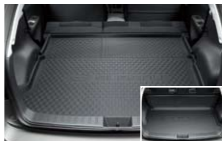
57 Laderaum-Schalenmatte faltbar große Ausführung J515EFG100 ★ W Schützt den Laderaum und die Rücksitze von hinten vor Verschmutzung. Große Ausführung faltbar.