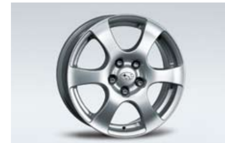
19 Alufelge 7,0 x 17\", ET 48 2747 ★ N