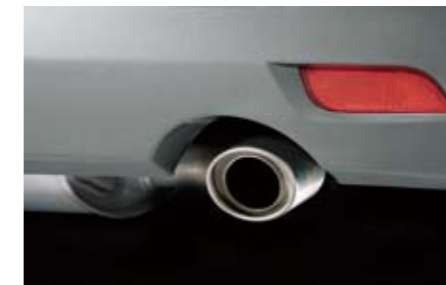
10 Edelstahlauspuffblende 2.0R 44370FG020 ★W Ein sportliches Detail mit auffälliger Wirkung.