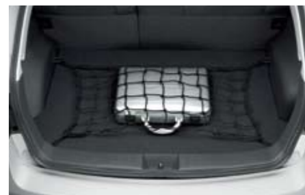
61 Gepäcknetz (Laderaumboden) F5510FG000 ★ W Sicherheit für das Transportgut und bessere Ordnung im Laderaum.