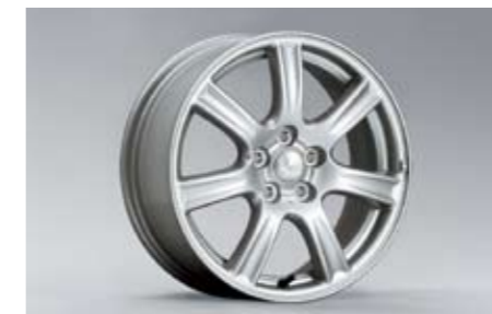
21 Alufelge 6,5 x 16\", ET 55 28111AG001 ★ W Nabenkappe zusätzlich notwendig.