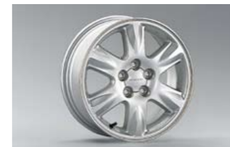
25 Alufelge 6,0 x 15\", ET 48 28111SA011 ★ W Nabenkappe zusätzlich notwendig.