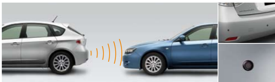
90 Ultraschall Einparkhilfe für vorne / hinten SEWAFG2100 / SEWAYA2000 ★ E Vorne: Erleichtert das Einparken wesentlich. Aktivierung über Geschwindigkeitssignal. Akustische Warnung. Hinten: Erleichtert das Einparken wesentlich. Aktivierung durch Einlegen des Rückwärtsganges. Akustische und optische Warnung.