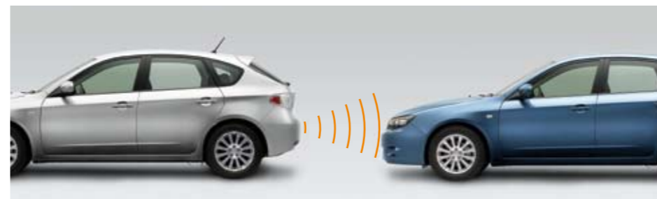
91 Ultraschall Einparkhilfe mit 4 Sensoren für hinten Ultraschallzusatzsensor (2 oder 4 Stück notwendig) zur Erweiterung von 2470 für vorne 2470 / 2470-01 ★ E Erleichtert das Einparken wesentlich. Aktivierung durch Einlegen des Rückwärtsganges. Akustische und optische Warnung - LED-Anzeige. 2470-01: Zur Erweiterung von 2470 für vorne (2 oder 4 Stück notwendig).