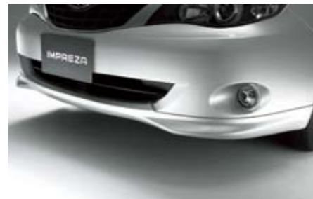
1 Sport-Frontschürze E2410FG00NN ★W Vermittelt einen sportlich-aggressiven Look. *Lackierung erforderlich.