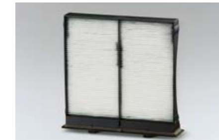
73 Innenluftfilter 72880FG000 ★W Verringert das Eindringen von Staub und Pollen in den Innenraum. Um die Wirkung zu erhalten, sollte der Filter jährlich oder alle 12.000 km gewechselt werden. *Zum Austausch des Originalfilters.