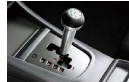
70 Aluminium Sportschaltknauf (Automatik) C101ESA002 ★W Ein sportlicher Touch. Mit Subaru Logo.