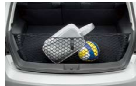
59 Gepäcknetz (Ladekante) F551SFG100 ★ W Sicherheit für das Transportgut und bessere Ordnung im Laderaum.