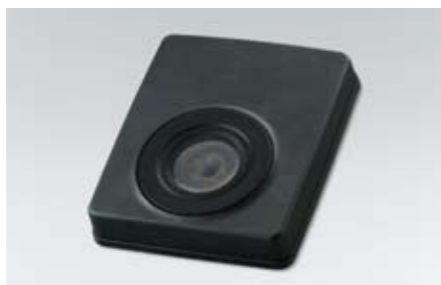
84 Subwoofer H6305FG000 W Mit zusätzlichen 120 Watt Ausgangsleistung zur deutlichen Verstärkung des Bassklangs.