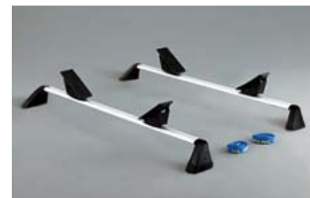
40 Kajak- und Bootaufsatz E361EAG600 ★W Für 1 Boot/Kajak. *Dachgrundträger zusätzlich notwendig.