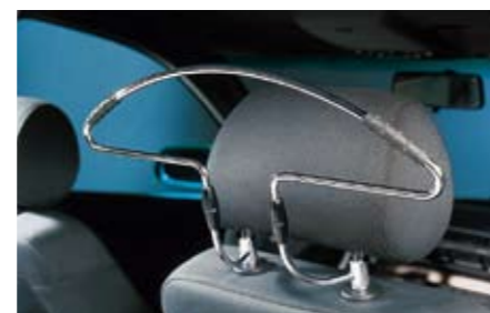
79 Autokleiderbügel zur Kopfstützenmontage 2405 N Zum Aufhängen von Kleidungsstücken. *Montage an der Kopfstütze.

Das abgebildete Fahrzeug ist ausgestattet mit Aluminium-Schaltknauf, Aschenbecher für Getränkehalter, Mittelarmstützenerhöhung, Navigationssystem.