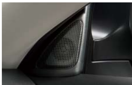
83 Hochtönersatz H6310FG000 W Spezielle Lautsprecher zur Verbesserung des Hochtonklangs. *Für serienmäßiges 1fach-CD-Radio.