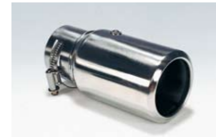
14 Edelstahlauspuffblende "Rund" 2021 ★N Ein sportliches Detail mit auffälliger Wirkung.