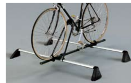
43 Fahrradaufsatz "Basic" E361ESA701 ★W Für herkömmliche Fahrradrahmen. *Dachgrundträger zusätzlich notwendig.