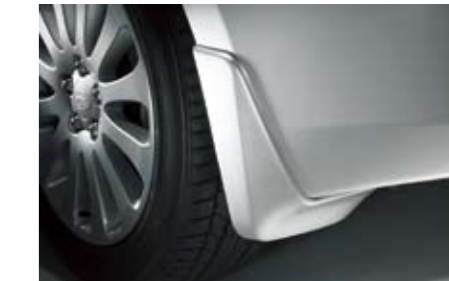
30 Schmutzfängersatz hinten J1010FG014NN Gegen Verschmutzung der Fahrzeugunterseite. *Lackierung erforderlich.