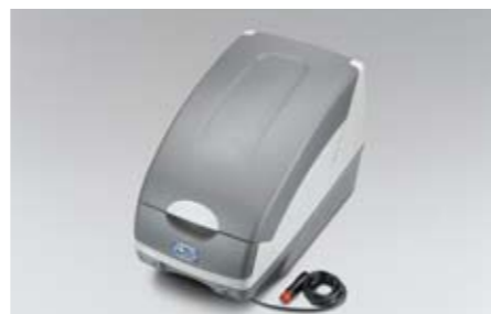
51 12V Auto Thermo Box SEWAYA1000 ★ E Hält Ihren Reiseproviant frisch. Montage auf der Rücksitzbank, 12V Stromanschluss.