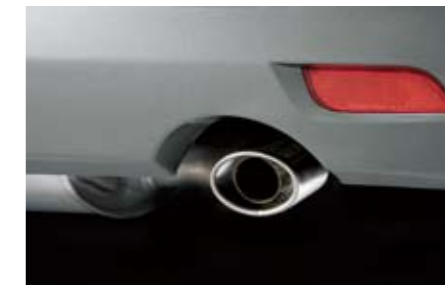
11 Edelstahlauspuffblende 1.5R D0510FG000 ★W Ein sportliches Detail mit auffälliger Wirkung.