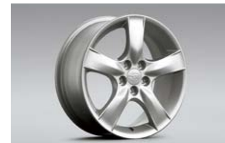
22 Alufelge 6,5 x 16\", ET 55 28111FE311 ★ W Nabenkappe zusätzlich notwendig.