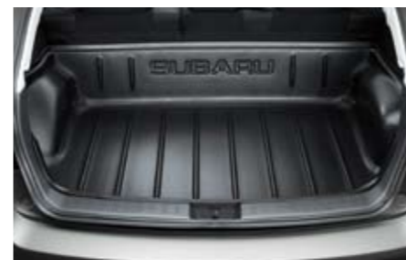
58 Laderaumbox J515EFG200 ★ W Zusätzlicher Schutz für den Laderaum. Besonders geeignet für Jagd und Fischen.