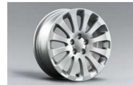
20 Alufelge 6,5x16\", ET 55 28111FG010 ★ W Nabenkappe zusätzlich notwendig.