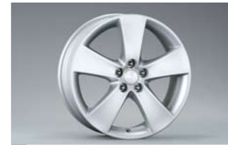
18 Alufelge 7,0 x 17\", ET 48 SECWAG4101 ★ E Nabenkappe zusätzlich notwendig.