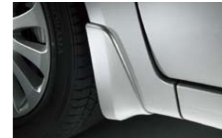
29 Schmutzfängersatz vorne J1010FG001NN Gegen Verschmutzung der Fahrzeugunterseite. *Lackierung erforderlich.