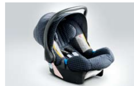
93 Kindersitz SUBARU BABYSAFE PLUS F410EYA102 ★ W Komplett mit Sonnenschutzdach.