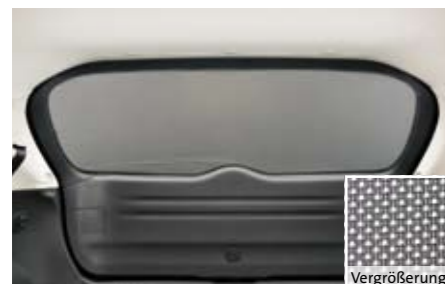
54 Sonnenschutzelement für Heckscheibe Laderaum F50SEFG000 ★ W Zum Schutz des Laderaums vor starker Sonneneinstrahlung von hinten. Maschenstruktur.