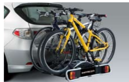
46 Fahrradaufsatz für Anhängerkupplung, System Thule (für 3 Räder) E365EFG900 ★W Zum Transport von 3 Fahrrädern. *Anhängerkupplung und E-Satz 13-polig zusätzlich notwendig.