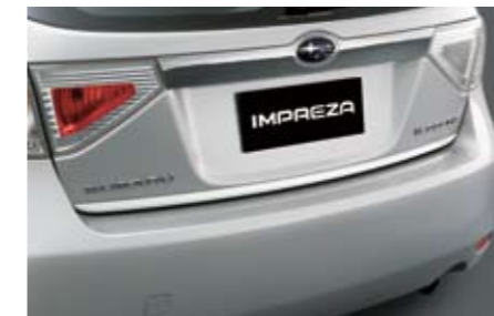
9 Chromoptik-Zierleiste Heckklappe E755EFG000 ★W Ein eleganter Chrom-Touch für die Heckklappe.