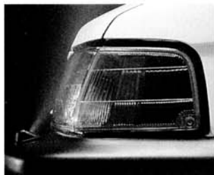
Scheinwerfer-Waschanlage - beim JUSTY 1200 mit Kat.