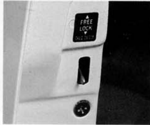
Kindersicherung hinten bei 5-Türen