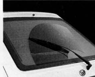
Heizbare Heckscheibe mit Wisch/Wasch-Anlage