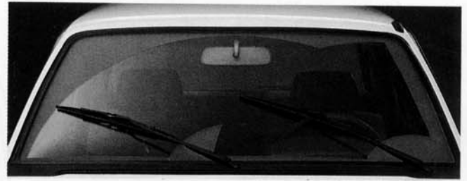
Frontscheibe mit Intervall-Scheibenwischer und Wisch/Waschanlage