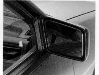
2 Außenspiegel - beim JUSTY 1200 von innen verstellbar