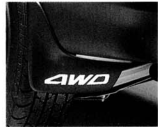
Schmutzfänger vorne und hinten