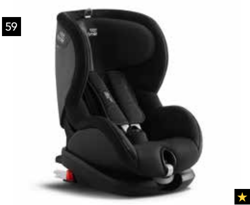
59 Kindersitz CRS Trifix2 XP R Cosmos Black

Sichere und schnelle Installation durch ISOFIX sowie sichere Unterstützung für Ihren Kindersitz. Ermöglicht das Baby hinzulegen oder aufrecht zu setzen. *In Kombination mit Babysafe i-Size.