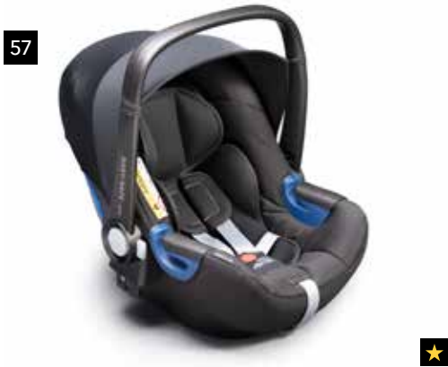
57 Kindersitz SUBARU Babysafe i-Size