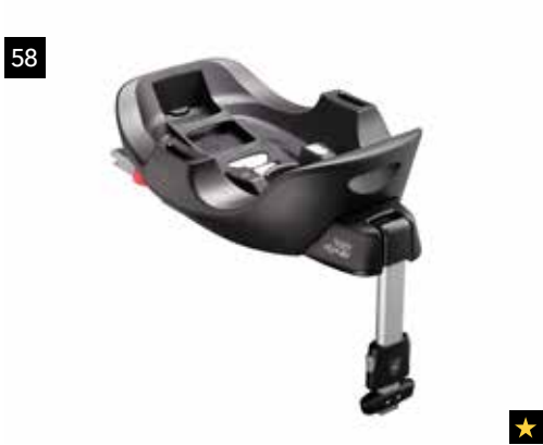
58 Kindersitz SUBARU Babysafe i-Size flex Plattform

Verbesserte Ergonomie und EURO NCAP-Seitenaufprall getestet. Für eine optimale Verwendung mit F410EYA310 kombinieren.