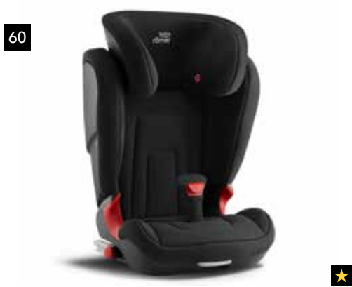
60 Kindersitz CRS Kidfix 2R Cosmos Black

Verbesserte Ergonomie und EURO NCAP-Seitenaufprall getestet.