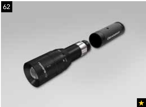
62 Wiederaufladbare Taschenlampe

Hochwertiger Innenraumluftfilter mit Aktivkohle und antimikrobieller Beschichtung. Speziell für Allergiker geeignet.